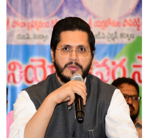
ఏదేని సమాచారం కొరకు కంట్రోల్ రూమ్ నెం. 08514 - 294898 కు ఫోన్ చేసి సంప్రదించవచ్చున్నారు. కంట్రోల్ రూమ్ ఈనెల 26 నుండి 28వ తేదీ వరకు 24 గంటల పాటు నిరంతరాయంగా పనిచేస్తుందని కలెక్టర్ ఆ ప్రకటనలో పేర్కొన్నారు.