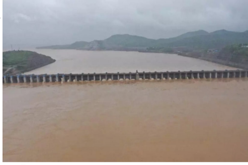
త్రిస్టర్ల రహదారులు మునిగిపోయాయి.పోలవరం ప్రాజెక్టుతో గోదావరి తగ్గుముఖం పట్టకుండా ఉండడంతో భవిష్యత్ తారల్లో కూడా దీంతో ప్రమాదం పొంచి ఉన్నదని నిపుణులు అంచనాలు వేస్తున్నారు.

విడుదల చేయడం ఇదే మొదటి సారి.మెడిగడ్ల 5.7 లక్షలు,సమృక్కు బ్యారేజ్ 7.8 లక్షలు నీటితో చింతారు వద్ద 31 అడుగులకు చేరుకున్న శబరి గోదారి,ఉపించిన దానికంటే ఎక్కువ ఉధృతి నెలకొన్నది,పోలవరం వద్ద గోదావరి వరద 11.5 మీటర్ల వద్ద ప్రవహిస్తున్నది,దవలేశ్వరం వద్ద 7.3 లక్షలు క్యూసెక్కు లు నీటిని క్రిందకు వదులుతున్నప్పటికీ వాగులు,వంకలు అనూహ్యంగా పొంగుతున్నది.వాగులు పొంగి పోర్లడంతో అన్ని తోటల్లు గ్రామాల రహదారులు మునుకుపోయాయి,చర్ల,చింతూరు,విఆర్ పురం,ఏటూరునాగారం,వరంగల్,వెంకటాపురం,చ