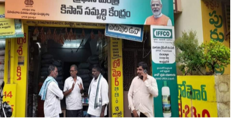
రైతులకు అండగా ప్రధానమంత్రి కిసాన్ సమ్మర్ది కేంద్రాలు.

ఆంధ్ర ప్రగతి నంద్యాల జూలై 26: జూలై 27వ తేదీ నుండి రాష్ట్రంలోని 4688 ఎరువుల రిటైల్ దుకాణాలను ప్రధానమంత్రి కిసాన్ సమ్మర్ది కేంద్రాలుగా మార్చడం జరుగుతుంది. 27 వ తేదీన ప్రధాని సరోజ్ మోడీ రాజస్థాన్ లోని శిఖర్ ప్రాంతంలో ప్రధానమంత్రి కిసాన్ సమ్మర్ది కేంద్రాలను లాంచనంగా ప్రారంభించడం, అలాగే రైతులకు 14వ విడత కిసాన్ సమాన్ నిధి ? .2000 రూపాయలను రైతుల బ్యాంక్ అకౌంట్లకు నేరుగా విడుదల చేస్తారు.జిల్లా వారీగా మండలాల వారీగా గుర్తించబడిన ప్రధానమంత్రి కిసాన్ సమ్మర్ది కేంద్రాలలో టీపీ టి ఏర్పాటు చేసి ప్రధాని ప్రసంగాన్ని వర్చువల్ ప్రారంభాన్ని రైతులకు చూపించడం జరుగుతుంది.నంద్యాలలోని కేంద్రాల వద్ద సన్నాహక ఏర్పాట్లు.