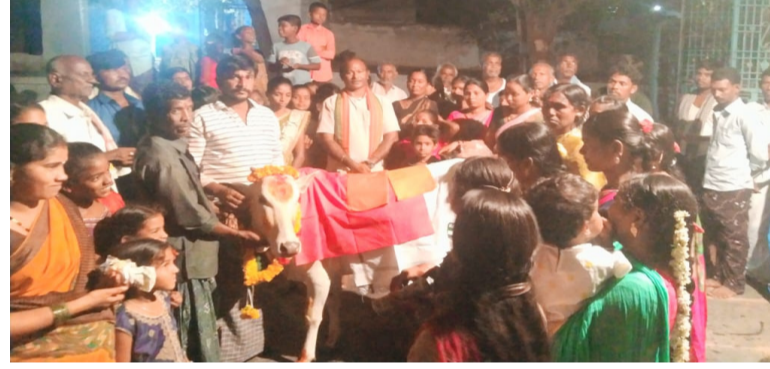
దూడెకొండ గ్రామం, పత్తికొండ మండలం నుండి. - గోవు భారత జాతి అపురూప సంపద.