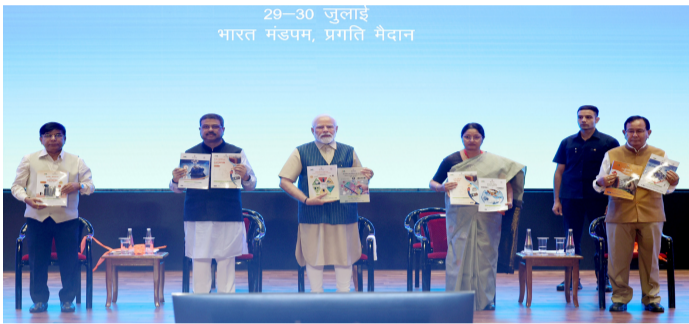
29-30 జూలై భారత సంఘం, భారతీయ విదాన

న్యూఢిల్లీ,జూలై29 : మన దేశంలో పరిపుష్టమైన, సౌభాగ్యవంతమైన భాషలు అనేకం ఉన్నాయని, అయితే అవి ప్రగతి నిరోధక భాషలనే ముద్ర వేశారని, ఇంత కన్నా దురదృష్టం వేరొకటి ఉంటుందా? అని ప్రధాన మంత్రి నరేంద్ర మోదీ ప్రశ్నించారు. జాతీయ విద్యా విధానం , 2020 మూడో వార్షికోత్సవం సందర్భంగా ఢిల్లీలోని ప్రగతి మైదానంలో శనివారం ఆయన అలిండియా ఎడ్యుకేషన్ కన్వెన్షన్ను ప్రారంభించారు. ఆంగ్లంలో మాట్లాడటం రానివారి ప్రతిభను ఎన్నడూ అమోదించేవారు కాదన్నారు. గ్రామీణ ప్రాంతాలవారు ఈ సమస్యను తీవ్రంగా ఎదుర్కొన్నారుని తెలిపారు. తాను ఐక్య రాజ్య సమితిలో కూడా భారతీయ భాష హిందీలోనే మాట్లాడతానని చెప్పారు. జాతీయ విద్యా విధానంలో ప్రాంతీయ భాషలకు ప్రాధాన్యం ఇస్తున్నట్లు తెలిపారు. దీనివల్ల దేశానికి ప్రయోజనం కలుగుతుందన్నారు. భాషలతో విద్వేష వ్యాపారాలు చేసేవారి షట్టర్లు మూతపడతాయని చెప్పారు. ఈ కార్యక్రమం ప్రగతి మైదానంలోని భారత్ మండపంలో జరిగింది. అఖిల భారతీయ శిక్షా సమాగమం పేరుతో శని, ఆదివారాల్లో ఈ కన్వెన్షన్ జరుగుతుంది. విద్యావేత్తలు, స్టడెంట్స్ నిపుణులు, విధాన నిర్దేశకులు, పారిశ్రామిక రంగ ప్రతినిధులు, ఉపాధ్యాయులు, విద్యార్థులు, ఇతరులు ఈ కార్యక్రమంలో పాల్గొంటారు.