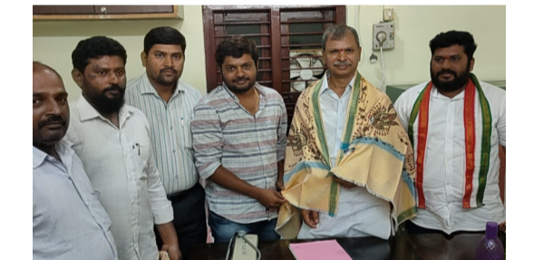
మెడిక్యూర్ హాస్పిటల్ ను సందర్శించిన కాంగ్రెస్ నాయకులు.