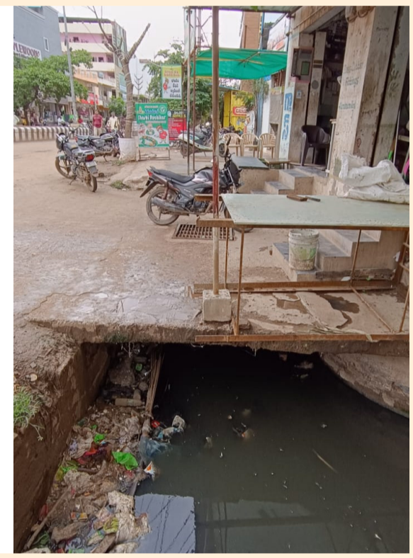
ఆంధ్ర ప్రగతి నంద్యాల జూలై 24: నంద్యాల : నంద్యాల జిల్లా కేంద్రంలోని పద్మావతినగర్ హౌసింగ్ సొసైటీ అక్రమాల తేనే తుట్టే కదులుతుంది. అక్రమాల పునరుద్ధరణపై వెలుగొందుతున్న పద్మావతినగర్ అక్రమాలు ఒకాకొక్కటిగా వెలుగు చూస్తున్నాయి. ఇప్పటికే వట్టూ భూముల్లో లే

-కేసి కెనాల్ ఛానల్ ను మింగేసిన పద్మావతినగర్ - సాసెటి లే అవుట్లో పిడబ్ల్యూడి ఛానల్ మాయం -వర్షపు నీటితో మునిగిపోతున్న పద్మావతి నగర్. -ఆక్రమణలతో చిన్నగా మారిన ఛానల్ కాలువ. -కోట్ల రూపాయలు పెట్టి కొన్న ప్రయోజనం లేదంటున్న ప్రజలు. -ఛానల్ పై వెలసిన రోడ్డు ప్లాట్లు . - డిటిసిపి చట్ట నిబంధనలను ఉల్లంఘించిన సాసెటి - పద్మావతినగర్ ప్రధాన రహదారిపై ఆక్రమణ ప్రభావం -ఛానల్ పై వెలసిన తాత్కాలిక దుకాణాలు.