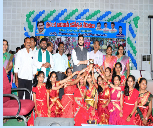
బాగా మారుతుందన్నారు. బడికూడు పిల్లలందరూ బడిలోనే ఉండాలని, స్కూల్ కు రాని పిల్లలను గుర్తించి తిరిగి స్కూల్లో చేర్పించాలని సంబంధిత నాయకులను సూచించారు. ప్రభుత్వం స్కూల్లో ఇంగ్లీష్ మీడియం ప్రవేశపెట్టడం ఒక మంచి ఉద్దేశమని దీన్ని సద్వినియోగం చేసుకొని ఇంగ్లీష్ మీడియంలో విద్యను అభ్యసించడం వల్ల పిల్లలు భవిష్యత్తులో ఎంతో పైకి ఎదిగే అవకాశం ఉందని కలెక్టర్ ఆశాభావం వ్యక్తం చేశారు. ఈ కార్యక్రమంలో వివిధ సంఘాల గిరిజన నాయకులు వివిధ అంశాలపై సమావేశంలో వివరించారు. ఈ సందర్భంగా గిరిజన నాయకులు జిల్లా కలెక్టరును శాలువాతో సన్మానించారు.