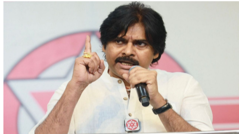
అర్చకుడిపై దాడి అధికార

పోరాడకుండా అడ్డుకుంటున్నారు" అని చంద్రబాబు నిప్పులు చెరిగారు. ఒక పథకం ప్రకారం తనను అడ్డుకుని, హత్య చేయడానికి ప్రయత్నించారని టీడీపీ చీఫ్ చంద్రబాబు ఆరోపించారు. ఎక్కడికెళ్లినా తనపై దాడులు చేస్తున్నారని మండిపడ్డారు. "నేను పారిపోవాలా? ఎన్ఎస్ఐ భద్రత ఉన్న నేనే పారిపోతే ఇక అర్థమేముంది? వైసీపీ ప్రభుత్వం చేసే దోపిడీని, అవినీతిని నేను ఎదుర్కొని తీరుతాను" అని తేల్చి చెప్పారు