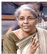
అని నిర్మలా సీతారామన్ అభివృద్ధిని మద్దతు పలికిన పార్టీలో ఒకరైన డీఎంకే తీరుని విమర్శించారు. అసెంబ్లీలో జయలలితను అవమానిస్తుంటే చూస్తూ ఎలా ఉన్నారంటూ డీఎంకే ఎంపీ కెఎమ్మోని మంత్రి నిలదీశారు.

చేయకూడదు. తమిళనాడు అసెంబ్లీలో 1989 మార్చి 25వ జరిగిన ఒక సంఘటన గురించి నేను ఈ సభ మొత్తానీ గుర్తు చేయాలని అనుకుంటున్నాను. అప్పుడు జయలలిత సీఎంగా లేరు. ఆమె సభలో ప్రతిపక్ష నేతగా ఉన్నారు. తమిళనాడు అసెంబ్లీలో జయలలిత చీర లాగాడు. డీఎంకే సభ్యులు ఆమె పట్ల హేళనగా నవ్వారు. జయలలితను డీఎంకే పరిరక్షించారు? మీరు ఆమె చీరను లాగేతారు. ఆమెను కించపరిచారు. తాను ముఖ్యమంత్రి అయ్యే వరకు తిరిగి సభకు రాకూడదని ఆమె ఆ రోజు తీర్మానించుకున్నారు. రెండేళ్ల తర్వాత సీఎంగా ఆమె సభలో అడుగుపెట్టారు"