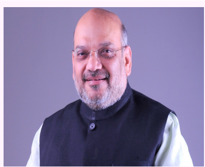
మూక దాడికి పాల్పడినా.. మైనర్ పై అత్యాచారం చేసినా ఇక మరణశిక్షే.

ఆంధ్ర ప్రగతి అమలాపురం ఆగస్టు 11: అక్క చెల్లెమ్మల ఆర్థిక సాధికారతే ధ్యేయంగా.. నా ద్వారా అక్క చెల్లెమ్మలను నిజమైన వ్యాపార వేత్తలుగా మార్చాలనే ఉద్దేశంతో దేశంలో ఎక్కడా లేని విధంగా రాష్ట్రంలో వైఎస్సార్ సున్నా వడ్డీ పథకం అమలు చేస్తున్నట్లు సీఎం జగన్ ప్రకటించారు. పేద అక్క చెల్లెమ్మలకు ఆర్థిక సాధికారత కల్పించి, వారు చేస్తున్న వ్యాపారాలకు ఊతమిచ్చేలా సున్నావడ్డీకి రుణాలు అందించి, వారి జీవన ప్రమాణాలను మెరుగుపరడమే మన ప్రభుత్వ లక్ష్యమని సీఎం జగన్ వివరించారు. డా. అంబేద్కర్ కోసనీమ జిల్లా అమలాపురంలో నిర్వహించిన వైఎస్సార్ సున్నా వడ్డీ నిధుల విడుదల కార్యక్రమంలో సీఎం జగన్ పాల్గొన్నారు.