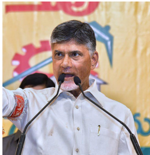
రాజధానులు కడతారట అంటూ ఎద్దేవా చేశారు. “ఒక రాజధానిని నాశనం చేసి మూడు రాజధానులని అంటున్నారు. మన రాజధాని ఏదంటే చెప్పుకోలేని దుస్థితిలో మనం ఉన్నాం” అని ఆవేదన వ్యక్తం చేశారు. వైసీపీని భూస్థాపితం చేస్తే తప్ప మనకు న్యాయం జరగదని అన్నారు

మండిపడ్డారు. సీమ కోసం జగన్ ఏనాడైనా పని చేశారా? అని ప్రశ్నించారు.తాము అధికారంలోకి వచ్చాక విద్యుత్ చార్జీలను తగ్గిస్తామని చంద్రబాబు హామీ ఇచ్చారు. ఆర్టీసీ బస్సుల్లో మహిళలకు ఉచిత ప్రయాణం కల్పిస్తామని చెప్పారు. 20 లక్షల కంటే ఎక్కువ ఉద్యోగాలు ఇస్తామని తెలిపారు. జాబు కావాలంటే బాబు రావాల్సిందేనని తేల్చిచెప్పారు. మూడు రాజధానులపై చంద్రబాబు వ్యంగ్యాస్త్రాలు సంధించారు. రోడ్డుకు మట్టి వేయలేరు కానీ 3