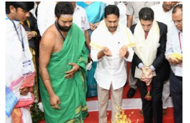
శంకుస్థాపన చేశామన్నారు. ఇవన్నీ ఉత్తరాంధ్ర రూపురేఖలను పూర్తిగా మార్చుతాయన్నారు. వీటి తర్వాత ఇప్పుడు విశాఖకు సాతిండియాలోనే అతిపెద్ద మార్ రానుందన్నారు. విశాఖలో ఒకటే హోటల్స్ రానున్నాయన్నారు. మరో హోటల్ వైస్ కూడా ఇక్కడకు రానుందన్నారు.

అన్ని విధాలుగా అండగా ఉంటామని, వారికి ఒక్క ఫోన్ కాల్ దూరంలో అందుబాటులో ఉంటామన్నారు. ఈ మార్ ఇక్కడకు రావడంతో విశాఖపట్నం రూపురేఖలు మారుతాయన్నారు. ఈ మార్ దక్షిణాదిలోనే అతిపెద్ద మార్ కావచ్చునని పేర్కొన్నారు. ఇక్కడ మార్ కోసం రూ.600 కోట్ల భారీ పెట్టుబడి పెడుతున్నారని, దీంతో ఎనిమిది వేలమందికి ప్రత్యక్షంగా, పరోక్షంగా ఉద్యోగ, ఉపాధి అవకాశాలు లభిస్తాయన్నారు. పన్నెండు, పదమూడు ఎకరాల స్థలంలో ఫేజ్ 2 కింద ఐటీ స్పీసెను తయారు చేస్తామన్నారు. ఇక్కడ ఇంటర్నేషనల్ స్టాండర్డ్ కనెక్షన్ల సెంటర్ నిర్మించే ప్రణాళికలు ఉన్నాయన్నారు. వీటి ద్వారా ఉద్యోగ, ఉపాధి అవకాశాలు పెరుగుతాయన్నారు. రానున్న రోజుల్లో విశాఖను గ్లోబల్ చార్జ్ పెట్టే విధంగా ముందుకు సాగుతున్నట్లు చెప్పారు. ఇది వరకు అదానీ డేటా పార్క్స్, భోగాపురం విమానాశ్రయానికి భూమిపూజ చేశామని గుర్తు చేశారు. శ్రీకాకుళంలోని మూలపేటలో సీపార్క్ కు