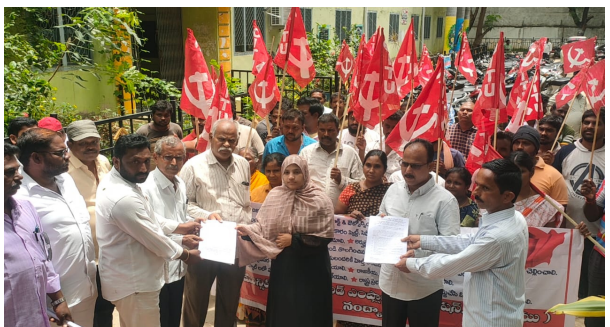
మున్సిపల్ కాంట్రాక్టు/అవుట్ సోర్సింగ్ కార్మికులందరికి ఇళ్ళ స్థలాలు మరియు ఇళ్ళు కట్టించి ఇవ్వాలి. మున్సిపల్ ఇంజనీరింగ్ కాంట్రాక్టు/అవుట్ సోర్సింగ్ కార్మికులందరికి ప్రభుత్వ సంక్షేమ పథకాలను అమలు చేయాలి. మున్సిపల్ కాంట్రాక్టు/అవుట్ సోర్సింగ్ కార్మికులు 60 సంవత్సరములు పూర్తి అయ్యి రిటైర్మెంట్ అయిన వారికి రిటైర్మెంట్ బెనిఫిట్స్ 5 లక్షల రూపాయలు ఇవ్వాలి.

కార్మికులందరి సమస్యల పరిష్కారము కొరకు ఆంధ్రప్రదేశ్ రాష్ట్ర కమిటీ వారు యిచ్చిన పిలుపులో భాగంగా ఆగస్టు 1వ తేదిన మున్సిపల్ ఆఫీసు ఆఫీసు వద్ద ధర్నా మున్సిపల్ కాంట్రాక్టు/అవుట్ సోర్సింగ్ కార్మికులందరిని పర్మినెంట్ చేయాలి.మున్సిపల్ కార్మికులందరికి %౧౫.జి.౫.౫%. నుండి మినహాయింపు యివ్వాలి. %+౫.పీ.ఓ.బీ.శీ%.151 ప్రకారం మున్సిపల్ ఇంజనీరింగ్ విభాగములోని అర్హత కలిగిన కాంట్రాక్టు కార్మికులందరికి స్టిల్డ్ మరియు సెమి స్టిల్డ్ వేతనాలు చెల్లించాలి.జి.ఓ.నెం.7, తేది: 17-1-2022 ప్రకారం కనీస విద్యా అర్హత మరియు సీనియారిటీ ప్రాతిపదికన అర్హత కలిగిన ఇంజనీరింగ్ కార్మికులకు స్టిల్డ్ మరియు సెమి స్టిల్డ్ వేతనములు చెల్లించాలి.మున్సిపల్ ఇంజనీరింగ్ విభాగములోని కాంట్రాక్టు/అవుట్ సోర్సింగ్ కార్మికులందరికి రూ.6000/-ల హెల్త్ అలవెన్సులు మరియు రిస్క్ అలవెన్సులు చెల్లించాలి. మున్సిపల్ కాంట్రాక్టు/అవుట్ సోర్సింగ్ కార్మికులందరికి పనిముట్లు మరియు రక్షణ పరికరములు ఇప్పించాలి.