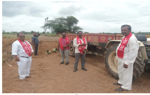
సాధించుకుంటున్నారని ఆరోపించారు. నంద్యాల జిల్లా కలెక్టర్ గారు అవినీతి రెవెన్యూ అధికారులపై ఉక్కు పాదం మోపుతున్నారని ప్రభుత్వానికి గండి కొట్టే వద్దటిలో అధికార పార్టీ నాయకులు చేస్తున్న అక్రమ రవాణా చేస్తున్న వారిపై కూడా చట్టపరమైన చర్యలు చేపట్టాలని లేనివకంలో సిపిఐ. ప్రజా సంఘాల ఆధ్వర్యంలో పెద్ద ఎత్తున ఆందోళనకు చేయడానికి సిద్ధంగా ఉన్నామని పై నాయకులు హెచ్చరించారు.

పరిశీలనకు వెళ్లిన సిపిఐ నాయకులను అధికార పార్టీ నాయకులు అధికారం మా చేతుల్లోనే ఉంది. మీకోసే అధికారులకు మరింత దబ్బులు పెంచుతామనడం కొనమెరుపు ?? ఈ సందర్భంగా పై నాయకులు మాట్లాడుతూ నంద్యాల జిల్లా లోని అనేక ప్రాంతాలతో పాటు కుందూ నది. చెరువుల ద్వారా వాగులలో ఉన్న ఇసుకను అధికార పార్టీ నాయకులు తన అనుచరులతో అక్రమంగా ఇసుక రవాణా చేస్తూ రెవెన్యూ అధికారులకు కొంత ముట్టజెప్పి కోట్ల రూపాయలు ప్రభుత్వ ఆదాయానికి గండి కొట్టి సంపాదించుకుంటున్నారని అక్రమ ఇసుక రవాణాను అరికట్టాలని సిపిఐ పార్టీ ఆధ్వర్యంలో చేసిన ఆందోళన ఫలితంగా రెవెన్యూ అధికారులు తూతూ మంత్రంలా పరిశీలించి అక్రమంగా ఇసుక రవాణా చేస్తున్న అధికార పార్టీ నాయకులు వారి అనుచరులతో లాలూచీపడి గతంలో ఇచ్చే పద్దతులు కాకుండా మరింత ఎక్కువ మొత్తాన్ని