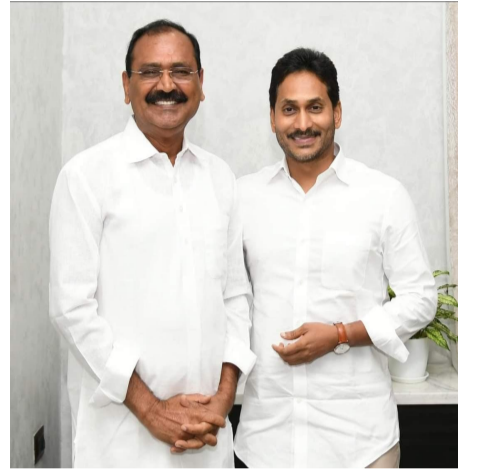
టీడీపీ కొత్త చైర్మన్ గా