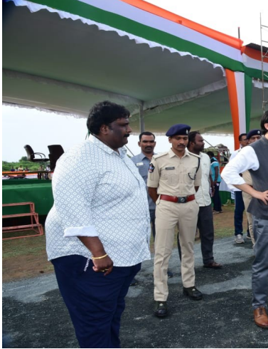
దినోత్సవ వేడుకలకు చేస్తున్న ఏర్పాట్లను జిల్లా కలెక్టర్ తో పాటు డిఆర్వో పుల్లయ్య, ఏఎస్పి వెంకట్రాముడు, సంబంధిత అధికారులు చేస్తున్న ఏర్పాట్లను కలెక్టరుకు వివరించారు. జిల్లా ఇన్చార్జి మంత్రి సాయి దళాల మార్చ్ ఫ్రాన్ట్ ను పరిశీలించే నిమిత్తం ఏర్పాటు చేసిన పరిశీలన

ఆంధ్ర ప్రగతి నంద్యాల, ఆగస్టు 14: నంద్యాల పట్టణంలోని స్థానిక ప్రభుత్వ డిగ్రీ కళాశాలలో నిర్వహించనున్న 77వ స్వాతంత్ర్య దినోత్సవ వేడుకలు ఏర్పాట్లను సోమవారం సాయంత్రం జిల్లా కలెక్టర్ డా.మనజిర్ జిలాని సమూన్ పరిశీలించారు. జూతీయ పతాక ఆవిష్కరణ మొదలుకొని కార్యక్రమ ఆరంభం వరకు చేస్తున్న ఏర్పాట్లను ఆయన పరిశీలించారు. వేదిక బ్యాక్ డ్రాప్, పోలీస్ సాయిత దళాల మార్చ్ ఫ్రాన్ట్, సీటింగ్ అరేంజ్మెంట్, పాఠశాల విద్యార్థుల సాంస్కృతిక కార్యక్రమాలు తదితర ఏర్పాట్లపై సంబంధిత అధికారులను అడిగి తెలుసుకున్నారు. డి ఆర్ డి ఏ, డ్యామా, ఎస్సీ కార్పొరేషన్, హౌసింగ్ , వ్యవసాయం స్త్రీసంక్షేమ శాఖ, గ్రామీణ నీటి సరఫరా, గిరిజన సంక్షేమం, వైద్య ఆరోగ్యం, ఉద్యోగం, రవాణా, సూక్ష్మ సేద్యం, సివిల్ సర్వెస్, అగ్నిమాపక తదితర శకలాలును ప్రదర్శించనున్నారు. అలాగే సంబంధిత శాఖలన్నీ కూడా తాము చేస్తున్న అభివృద్ధి కార్యక్రమాలపై చేస్తున్న ఛాయాచిత్ర ప్రదర్శన ఏర్పాట్లను కలెక్టర్ పరిశీలించారు. స్వాతంత్ర