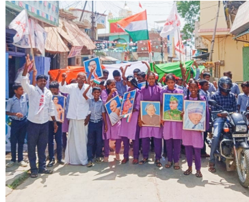
ఉందని వారన్నారు. ఎంతోమంది సమరయోధులు స్వాతంత్ర్యం తీసుకొచ్చింది ఇందుకేనా అని నూటిగా ప్రశ్నిస్తున్నాము . ఈ కార్యక్రమంలో విద్యార్థులు పాల్గొన్నారు.

సమరయోధులు స్వాతంత్ర్యం తీసుకొచ్చింది స్వేచ్ఛ సమానత్వం కోసం అయితే ఈ కేంద్ర ప్రభుత్వం స్వేచ్ఛ సమానత్వం కాకుండా పూర్తిగా కాపాయికరణ చేయడానికి పాల్పడుతుందని అన్నారు. స్వాతంత్ర్యం వచ్చి ఎన్ని సంవత్సరాలు అవుతున్న ఆడవాళ్లకు ఎక్కడ రక్షణ లేదు లైంగిక దాడులు మర్డర్లు మన భారతదేశంలో ఎక్కువ స్థాయిలో జరుగుతున్నాయి. అదేవిధంగా భారత రాజ్యాంగ నిర్మాత డాక్టర్ బి.ఆర్ అంబేద్కర్ రాజ్యాంగాన్ని కూడా రక్షణ లేకుండా అవుతుంది. రాజ్యాంగబద్ధ పాలన కాకుండా రాజకీయమైన పాలన చేస్తున్నారని దీనివల్ల ఎంతోమంది పేదలు కూడా గూడు బట్టలేని నిరుపేదలు మన భారతదేశంలో ఉండడానికి కూడా సిగ్గుపడేలా