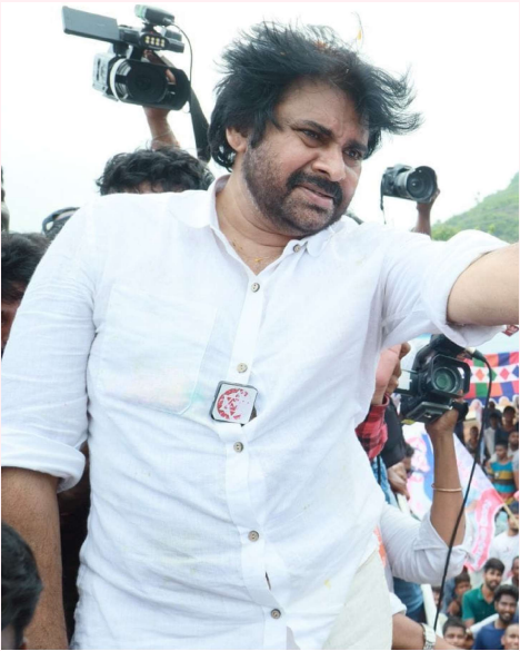
అనకాపల్లి, ఆగస్టు 14 జగన్ ప్రభుత్వంపై జనసేన అధినేత పవన్ కళ్యాణ్ మరోసారి విరుచుకు పడ్డారు. సోమవారం విన్నపాలను పంపించిన పవన్ ఆపై మీడియాతో మాట్లాడుతూ..

రాష్ట్రంలో యువతకు ఉపాధి లేదని.. జాబ్ క్యాలెండర్ లేదని మండిపడ్డారు. అడ్డగోలుగా రియల్ ఎస్టేట్ వ్యాపారం చేస్తున్నారని ఆరోపించారు. వాళ్ళా చట్టం తుంగలోకి తొక్కారన్నారు. ఉత్తరాంధ్ర మీద వైసీపీ ప్రభుత్వానికి ప్రేమ లేదని.. కేవలం ఉత్తరాంధ్ర భూములు మీద ప్రేమ అంటూ వ్యాఖ్యలు చేశారు. పర్యావరణ విధానం కలిగిందన్నారు. ఈ ఉరిలోకి రావడానికి ఇరుకు రోడ్ ఉందని.. కానీ వీరి రియల్ ఎస్టేట్ కు మాత్రం పెద్ద రోడ్ వేసుకున్నారని మండిపడ్డారు. మంత్రి గుడివాడ అమర్నాథ్ కాదు.. నేను సీఎంసీ అడుగుతున్నాను. ఏంటీ ఈ దోపిడీ, దాష్టీకం అంటూ ప్రశ్నించారు. కొండలను పిండి చేశారని.. ప్రభుత్వ భూములు, రైతులు భూములను అక్రమించి వ్యాపారం చేస్తున్నారని తీవ్రస్థాయిలో విరుచుకుపడ్డారు. విన్నపాలను మీద కేంద్ర పర్యావరణ శాఖకు ఫిర్యాదు చేయనున్నట్లు తెలిపారు. అలాగే గ్రీన్ ట్రిబ్యూనల్ కు కూడా ఫిర్యాదు చేయనున్నట్లు పవన్ కళ్యాణ్ వెల్లడించారు. వైసీపీ నేతలు మాత్రం పెద్ద అక్రమ వెంచర్లతో రియల్ ఎస్టేట్ వ్యాపారం చేస్తున్నారని పవన్ కళ్యాణ్ మండి పడ్డారు. ఉత్తరాంధ్ర మీద వైసీపీ ప్రభుత్వానికి ప్రేమ లేదని.. కేవలం ఉత్తరాంధ్ర భూములు మీద ప్రేమ అంటూ వ్యాఖ్యలు చేశారు. విన్నపాలను ఉరిలోకి రావడానికి ఇరుకు రోడ్ ఉందని.. కానీ వీరి రియల్ ఎస్టేట్ కు మాత్రం పెద్ద రోడ్ వేసుకున్నారని మండిపడ్డారు. ఉత్తరాంధ్ర భూములను దోచేస్తుంటే మాట్లాడేవాడు లేదని, స్థానిక ఎమ్మెల్యేలు కూడా వత్సాను పలుకుతున్నారని మండిపడ్డారు. విన్నపాలను గ్రామంలో అనుమతులు లేనిచోట రియల్ ఎస్టేట్