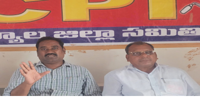
పొలాలు రిజిస్టర్ కానందున రైతులు మానసికంగా ఆర్థికంగా ఇబ్బందులు గురి అవుతున్నారని వెంటనే జిల్లా రెవెన్యూ అధికారులు ఆయా మండలాల్లో ఉన్న చుక్కల భూముల రికార్డులను తెప్పించుకొని వాటిని ప్రభుత్వ భూమిగా ఉన్న పొలాలను పట్టా భూమిగా మార్చు చేసి రిజిస్టర్ జరిగే విధంగా ఉమ్మడి ప్రాసీడింగ్ ఆర్డర్ గా ఇవ్వాలని పై నాయకులు డిమాండ్ చేశారు.

జాబితా నుండి తొలగించిన నంద్యాల జిల్లాకు జీవో నెంబర్ 179 ద్వారా నిషేధిత నుండి తొలగించిన భూములు రిజిస్టర్ అయ్యేందుకు ప్రభుత్వం వీలు కల్పించిన కానీ భూమి న్యభావము. అనే కాలంలో ప్రభుత్వ భూమి అని ఉన్నందున ఆయా నబ్ రిజిస్టర్ ఆఫీసులో సిస్టం తీసుకోక పోవడం వలన రైతులకు అత్యవసర పరిస్థితిలో రైతులు వాటిని అమ్ముకునేందుకు వీలు కావడం లేదని దీనికి రెవెన్యూ అధికారుల నిర్లక్ష్య కారణమని అన్నారు. నంద్యాల జిల్లా రెవెన్యూ అధికారులకు సీఎం ద్వారా సంతకం తో వచ్చిన బువ్వకు పత్రాలను ఇంతవరకు సంబంధిత ఏ ఒక్క రైతుకు ఇవ్వకపోవడం జరిగిందని జిల్లా రెవెన్యూ అధికారుల నిర్లక్ష్యం వల్ల ఇంతవరకు ఆయా