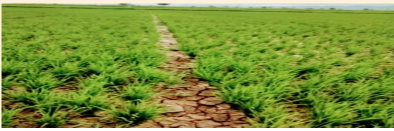
ఆంధ్ర ప్రగతి ఆత్మకూరు ఆగస్టు 27. నంద్యాల జిల్లా కొత్తపల్లి మండలం సింగరాజు పల్లె గ్రామంలో గంగ రేవు చెరువులో నీళ్లు చెరువు క్రింద ఉన్న పొలాలకు నీళ్లు పంపిణీ చేయడం ద్వారా చెరువు క్రింద పంట పొలాలు పంటలు పండుతాయి కానీ అదే గ్రామానికి చెందిన రైతులకు చెరువు పైన

చిన్న సన్నకారు రైతులు ఉన్నారా వారు అప్పులు తెచ్చి పంటలకు వేలకు వేలు పెట్టుబడి పెట్టి విత్తనాలు వేశారు కానీ వానలు లేక కళ్ళముందే పంటలు ఎండిపోతున్నాయి రైతులు కంటతడి పెట్టారు. ప్రకృతి చెరువు నిండ నీళ్లు ఉండి కూడా ర చేరుపైనే ఉన్న రైతు పొలాలకు నీళ్లు ఇవ్వడం లేదు అని మనోచేదనకు తెలియచేశారు వానలు లేక వేసిన పంటలు భూమిపాలు అవుతున్నాయి అని మానవతా దృక్పథంతో ఆలోచించి కట్ట క్రింద ఉన్న పొలాలకు కట్ట పైన ఉన్న పొలాలకు నీళ్లు అందేలా చూడాలని రైతులు తెలియచేశారు కట్ట పైన పొలాలకు చెరువు నీళ్లు ఇవ్వక వానలు పడక పంటలు నష్టం వస్తే చేసిన అప్పుల బాధలు తట్టుకోలేక ఆత్మహత్య లే దారి అని తెలియచేశారు. కానీ అదే జరిగితే అది రైతుల ఆత్మహత్యలు కావు అధికారుల నిరక్షం ఉండి నీళ్లు ఇవ్వనందుకు ప్రభుత్వ అత్యల్తే అని రైతులు కంట తడితో వారి బాధలను తెలియచేశారు.