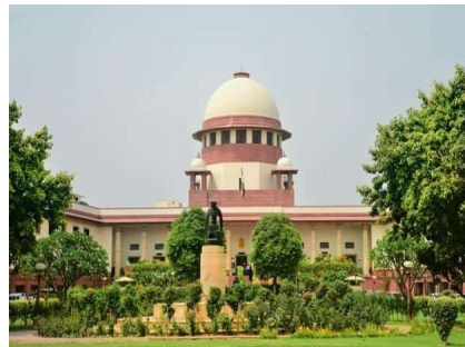
అమరావతి ఆర్డర్ జోన్ పై సుప్రీంకోర్టులో పీఠీ ప్రభుత్వానికి చుక్కెదురు

- ఏ సీజన్లో పంట నష్టం జరిగితే అదే సీజన్ లో సాయం అందిస్తున్నాం: సీఎం జగన్