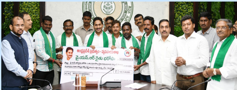
ఆర్డులైన.. ఎస్సీ, ఎస్టీ, బీసీ, మైనార్టీ కౌలుదారులు, అలాగే.. 2023%--%24 సీజన్కు సంబంధించి తొలి విడత దేవదాయ భూములను సాగు చేస్తున్న రైతులకు ఒక్కొక్కరికి పెట్టుబడి సాయం ఇదని రైతులకు సాయం చేయటం చాలా ఆనందంగా ఉందని అన్నారు. మిగతాది 2లో...

ఆంధ్ర ప్రగతి అమరావతి సెప్టెంబర్ 1: ఈ నాలుగేళ్లలో వ్యవసాయంలో విప్లవాత్మక మార్పులు మన రాష్ట్రంలో చూడగలిగాం. రాష్ట్రంలో కౌలు రైతులకు రైతుభరోసా నిధులు నేడు విడుదల అయ్యాయి. తాదేపల్లిలోని సీఎం కార్యాలయం నుంచి సీఎం వర్చువల్ గా బటన్ నొక్కి నిధుల్ని జమ చేశారు. మన రాష్ట్రంలోని 1,46,324 మంది కౌలు రైతులకు రూ. 109.74 కోట్లు జమ చేసినట్లు సీఎం జగన్ పేర్కొన్నారు. దేశంలో ఎక్కడా లేని విధంగా కౌలు రైతులకు తోడుగా నిలబడే ప్రభుత్వం బహుశా ఎక్కడా లేదేమోనని, దేశంలోనే తొలిసారిగా కౌలు రైతులతో పాటు దేవదాయ, అటవీ భూములను సాగు చేస్తున్న వాస్తవ సాగుదారులకు కూడా వైఎస్ఆర్ రైతు భరోసా వర్తింపజేస్తోందని అని సీఎం తెలిపారు. పంట హక్కు సాగు పత్రాలు పొందిన వారిలో