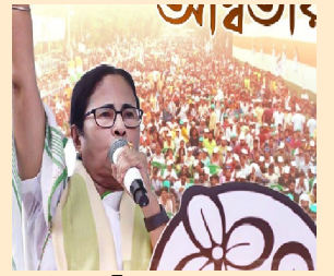
వారికి పింఛన్ కూడా అందిస్తున్నట్లు తెలిపారు. దేశవ్యాప్తంగా వేలాది దేవాలయాలు ఉన్నాయన్నారు. దేవాలయం, చర్చి, మసీదు అన్ని చోట్లకూ తాము వెళ్తామన్నారు

మనం ప్రతి మతానికి సమాన గౌరవం ఇవ్వాలన్నారు. తమిళనాడు, దక్షిణ భారతదేశ ప్రజలను తాను గౌరవిస్తానని, కానీ ఏ మతమైనా మనోభావాలు దెబ్బతీయడం సరికాదన్నారు. అలాంటి వ్యాఖ్యలు చేయవద్దని విజ్ఞప్తి చేస్తున్నానని వ్యాఖ్యానించారు. భారతదేశం భిన్నత్వంలో ఏకత్వం కలిగిన దేశమన్నారు. సనాతన ధర్మాన్ని తాను గౌరవిస్తానని, వేదాల నుండి ఎంతో నేర్చుకుంటామన్నారు. బెంగాల్ లో చాలామంది పురోహితులు ఉన్నారని,