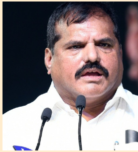
చెబుతూ, నెల రోజుల్లో అన్ని విశ్వవిద్యాలయాల్లో పోస్టుల భర్తీ ప్రక్రియ చేపడతామని స్పష్టం చేశారు.

సాంకేతిక కారణాలతోనే జీతాలు ఆలస్యమవుతున్నాయి -: మంత్రి బొత్తు ఉపాధ్యాయ దినోత్సవం సందర్భంగా విశాఖ ఆంధ్రా యూనివర్సిటీ కాన్వోకేషన్ హాలులో గురు పూజ్యోత్సవ కార్యక్రమం ఏర్పాటు చేశారు. రాష్ట్ర విద్యాశాఖ మంత్రి బొత్తు సత్యనారాయణ ముఖ్య అతిథిగా ఈ కార్యక్రమానికి హాజరయ్యారు. రాష్ట్రంలో ఉత్తమ ఉపాధ్యాయులుగా ఎంపికైన వారికి బొత్తు పురస్కారాలు అందించారు. ఈ కార్యక్రమానికి డిప్యూటీ సీఎం బూడి ముఖ్యాలనాయుడు, మంత్రి గుడివాడ అమర్నాథ్ తదితరులు కూడా హాజరయ్యారు. ఈ కార్యక్రమానికి విచ్చేసిన మంత్రి బొత్తు మాట్లాడుతూ, టీవర్షకు జీతాలు లేవని కొందరు విమర్శిస్తున్నారని, అయితే సాంకేతిక కారణాలతో జీతాలు ఆలస్యమవుతున్నాయని అన్నారు. ఈ నెల 7, లేదా 8 తేదీల్లో ఉపాధ్యాయుల ఖాతాల్లో జీతాలు జమ చేస్తామని పేర్కొన్నారు. నియామకాల గురించి