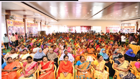
ఆంధ్ర ప్రగతి బనగానపల్లె సెప్టెంబర్ 8: ఆళ్లగడ్డ నియోజకవర్గం సిరివెళ్ల మండలం లో సీనియర్