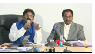
గురించి మొదట పుణే నుంచి జీవోస్ అధికారులు గుర్తించి అప్పటి ఏపీ ప్రభుత్వానికి లేఖ ద్వారా అప్రమత్తం చేశారని ఏపీ పేర్కొన్నారు. 2018, మే 14వ తేదీన ఏపీ ఏసీబీ డీజీకి లేఖ రాశారని, అందులో రూ.371 కోట్లు నిధులు చేతులు మారాయని ప్రభుత్వాన్ని అలర్ట్ చేసినట్లు స్పష్టంగా ఉందని తెలిపారు. స్కాం కారకులనే పుణే జీవోస్ విభాగం అప్రమత్తం చేసినదన్న విషయం గమనించాలని అన్నారు. అందుకే వ్యవహారం ముందుకు సాగలేదని ఏపీ పాన్చవోలు రెడ్డి వివరించారు. వేరువేరు శాఖల ఫేక్ ఇన్వాయిస్ ద్వారా నల్ల డబ్బు తెల్ల డబ్బుగా మార్చిన పీఏ, ఆయన అకౌంట్స్ నుంచి చంద్రబాబు అకౌంట్ కి నిధులు జమ అయ్యినట్లు ఆధారాలు దోరికాయని తెలిపారు.

అధికారుల వాదనను అప్పటి ముఖ్యమంత్రి చంద్రబాబు నాయుడు పట్టించుకోలేదు”- ఏపీ పాన్చవోలు సుధాకర్ రెడ్డి జీవోలో ఉన్న అంశాలు అగ్రిమెంట్ లో లేవు స్కిల్ డెవలప్మెంట్ స్కామ్ లో జీవో కంటే ముందే అగ్రిమెంట్ తయారీ అయ్యిందని, తప్పుడు ప్రత్రాలతో ఒప్పందాలు చేశారని సీఐడీ చీఫ్ సంజయ్ తెలిపారు అగ్రిమెంట్ లో జీవో వెంబర్సు చూపించలేదని జీవోలో ఉన్న అంశాలు అగ్రిమెంట్ లో లేవని పేర్కొన్నారు. ఏపీ స్కిల్ డెవలప్మెంట్ స్కామ్ లో రూ.371 కోట్ల అవినీతి జరిగిందని, నిబంధనలకు విరుద్ధంగా రూ.371 కోట్లను రిట్రీవ్ చేశారని చెప్పారు. తప్పుడు డాక్యుమెంట్స్ తో ఒప్పందాలు చేసుకున్నారని, ప్రభుత్వ జీవోలకు, అగ్రిమెంట్ కు చాలా తేడాలు ఉన్నాయని అన్నారు. కార్పొరేషన్ ఏర్పాటులోనూ విధి విధానాలు పాటించలేదని, కార్పొరేషన్ నుంచి ప్రైవేటు వ్యక్తులకు డబ్బులు వెళ్లాయని ఆ ప్రైవేట్ వ్యక్తుల నుంచి పెల్ కంపెనీలకు మళ్లాయని వివరించారు. చంద్రబాబు నాయుడు హయాంలో ఏర్పాటైన స్కిల్ డెవలప్మెంట్ కార్పొరేషన్ అవకతవకల