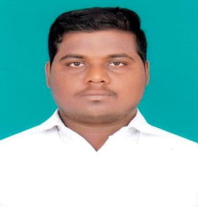
సమావేశాలలో రాష్ట్ర హక్కులు కోసం గళం విప్పాలని డిమాండ్ చేస్తున్నాం అన్నారు. లేకుంటే చరిత్ర హీనులుగా ప్రజల వద్ద మిగులుతారు అన్నారు

తెస్తానని ఇప్పుడు అధికారం లోకి వచ్చాక తానే కేంద్రం దగ్గర మెడలు వంచుతున్నాడు అన్నారు. రాష్ట్ర ప్రభుత్వం కూడా కేంద్రాన్ని నిలదీయలేని పరిస్థితులలో వుంది అన్నారు. పార్లమెంటు సమావేశాలలో బీజెపికి బహిరంగంగా మద్దతు తెలుపుతూ రాష్ట్ర హక్కులను కేంద్రం వద్ద తాకట్టు పెడుతుంది అన్నారు. కడప ఉక్కు పరిశ్రమ వస్తే రాయలసీమ లో నిరుద్యోగ యువతకు ఉద్యోగాలు వచ్చే అవకాశం వుంది అన్నారు. ఇప్పటికీ అయిన ప్రస్తుతం జరిగి పార్లమెంటు