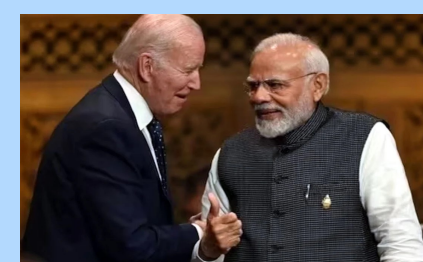
తెలుస్తోంది. భారత్ గణతంత్ర వేడుకలు జరుపుకునే జనవరి 26నే ఆస్ట్రేలియా జాతీయ దినోత్సవం జరుపుకుంటుంది. ఈ సేవధ్యంలో అదే రోజు జరిగే క్యాడ్ నేతల సమావేశానికి కూడా ప్రధాని అల్బానీస్ హాజరు కావడం లేదని సమాచారం

అందించినట్లు తెలిపారు. నిజానికి భారత్ రిపబ్లిక్ వేడుకలకు 'క్యూడ్' నేతలందరినీ ఆహ్వానించాలని భారత్ భావించినట్లు తొలుత వార్తలు వచ్చాయి. ఆస్ట్రేలియా ప్రధాని ఆంథోనీ అల్బానీస్, జపాన్ ప్రధాని ఫుమియో కిషిదా వంటివారు ఈ జాబితాలో ఉన్నారు. అయితే, ప్రపంచ నేతల అందుబాటును బట్టి తుది నిర్ణయం తీసుకున్నట్లు తెలుస్తోంది. భారత్ రిపబ్లిక్ వేడుకలకు ముఖ్య అతిథిగా హాజరయ్యేందుకు బైడెన్ అంగీకరించినట్లు కూడా