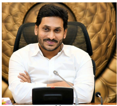
గెలుపే లక్ష్యంగా ఉన్న వైసీపీ అధినేత.. ఎన్నికల ముందే టీడీపీని కట్టడి చేయడంలో కొంత సక్సెస్ అయ్యారు. ఇప్పుడు తాజా పరిస్థితులను వైసీపీకి అనుకూలంగా మార్చుకొని తిరుగులేని విజయం సాధించాలని జగన్ ప్లాన్ చేశారు. మరి ఆయన వ్యూహాలు ఎంతవరకు ఫలిస్తాయో చూడాలి

పర్యటనలు ఆగిపోయాయి లోకేష్ పాదయాత్ర హెల్త్ లో పడింది. టీడీపీ ప్రణాళికలు, ప్లాన్స్ అన్నీ కూడా పటాపంచలు అయ్యాయి. వ్యూహాత్మకంగా టీడీపీ వ్యూహాలకు చెక్ పెట్టడంలో జగన్ సక్సెస్ అయ్యారనే చెప్పాలి. ఇప్పుడు టీడీపీ స్టాండ్ ను పూర్తిగా భర్తీ చేసేందుకు వైసీపీ ప్రచారానికి శ్రీకారం చుట్టోతుందట. త్వరలోనే “ వల్లెల పోదాం అనే కార్యక్రమానికి జగన్ సిద్ధమౌతున్నట్లు టాక్.అలాగే ఇక నియోజిక పర్యటనలు కూడా చేసేందుకు జగన్ పక్కా ప్రణాళికలు రెడీ చేసుకున్నారు. ఎక్కడ టీడీపీ ప్రస్తావన లేకుండా మొత్తం ప్రజల నోట వైసీపీ మాటే వినిపించేలా ప్రచారాలు నిర్వహించాలా జగన్ ప్లాన్ చేశారట. కాగా “ ఇంటింటికి మన ప్రభుత్వం “ మా తోడు నువ్వే జగన్ వంటి కార్యక్రమాల ప్రజల్లో పెద్దగా ప్రభావం చూపలేకపోయాయి. దాంతో ఈసారి చేపట్టే ప్రతి కార్యక్రమం కూడా ప్రజల్లో పూర్తి మద్దతు లభించేలా రెడీ చేశారట అధినేత జగన్మోహన్ రెడ్డి. మరి ఎన్నికల్లో 175 సీట్లలో