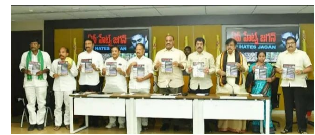
జగన్ నెరవేర్చని హామీల లిస్టు చానాడంత ఉందని ఎప్పుడెప్పుడు వదిలించుకుందామా అని ఉద్యోగులు, నిరుద్యోగులు ఎదురు చూస్తున్నారని తెలిపారు.

విద్యుత్ ఛార్జీల భారమే రూ.64 వేల కోట్లని మండిపడ్డారు. నాసిరకం మద్యంతో 35 లక్షల మందిని రోగాల బారిన పడేలా చేశారని 30 వేల మంది ప్రాణాలు కోల్పోయారని ఆరోపించారు. మద్యం ద్వారా వచ్చిన ఆదాయంలో తాడేపల్లి ప్యాలెస్ లక్ష కోట్ల కమిషన్ కొట్టేసిందని దుయ్యబట్టారు. తన దోపిడీని ఎదుటివారికి అంటగట్టిచెప్పిన అబద్ధమే వందసార్లు చెప్పడం జగన్ రెడ్డి నైజమని నేతలు ఆగ్రహం వ్యక్తం చేశారు. మేనిఫెస్టోలోని హామీలన్నీ నెరవేరని చెప్పుకోవడానికి సిగ్గుండాలన్నారు.