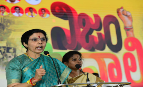
వెళ్లేదాన్ని.. కానీ మొన్న ఒక్కదాన్నే వెళ్లారు. చంద్రబాబు అరెస్టుతో నలుగురు నాలుగు దిక్కులయ్యాయి. చంద్రబాబును నిర్బంధించి 48 రోజులు అయింది. మిగతాది 3లో...

ఆంధ్ర ప్రగతి తిరుపతి అక్టోబర్ 26: నాలుగున్నరేళ్లలో రాష్ట్రానికి ఒక్క పరిశ్రమైనా వచ్చిందా.. మన బిడ్డలకు ఒక్క ఉద్యోగమైనా అని నారా భువనేశ్వరి ప్రశ్నించారు. వేధించడం, ఇబ్బందులు పెట్టడం గొప్ప అనుకుంటున్నారని మండిపడ్డారు. నిరాహార దీక్షల చేసిన వారిపై హత్యాయత్నం కేసులు కాదు... ఎందుతున్న పోలాలకు నీళ్లవ్వండిని సూచించారు. ప్రభుత్వ దృష్టి చంద్రబాబు రాసిన లేఖపై కాదని, అభివృద్ధిపై పెట్టాలన్నారు. 'నిజం గెలవాలి' కార్యక్రమంలో భాగంగా రెండో రోజు తిరుపతిలోని అంకర ఆసుపత్రి పక్కన ప్రాంగణంలో ఏర్పాటు చేసిన బహిరంగ సభలో గురువారం భువనేశ్వరి ప్రసంగించారు. “మా ఇంట్లో ఎప్పుడు శుభకార్యం జరిగినా మా మనసులోకి వచ్చేది వెంకటేశ్వరస్వామి. ఎప్పుడు వెళ్లినా కుటుంబ సమేతంగా