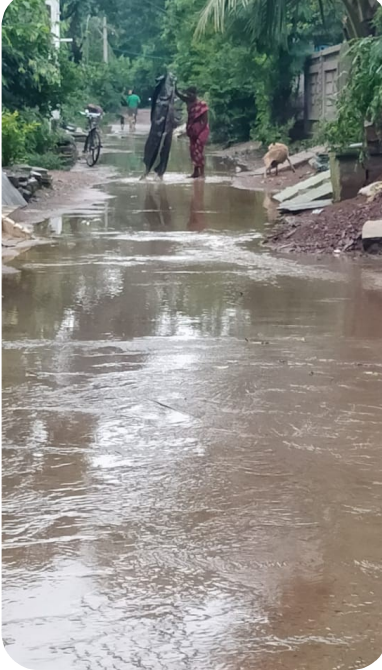
సమస్యలు ఏమి లేవని రహదారులు, మురుగు కాల్వలు ప్రాక్షేను ద్వారా సమస్యను పరిష్కరించ దం జరిగిందని ఉన్నతాధికారులకు తప్పుడు సమాచారం ఇచ్చి సమస్య పరిష్కారం అయిన దని, ఫిర్యాదు దారు రుద్దీ, ఒప్పుకొని సంతకం పెట్టాలని ఒత్తిడి చేస్తున్నారని భాదితులు తెలిపారు. ఈ సమస్యను పంచాయతీ అధికారులు శాశ్వతంగా పరిష్కరించాలని దళిత కాలనీ వాసులు కోరుతున్నారు.

పరీక్షలకు, మందులకు సరిపోతుందని, ఈ సమస్యలు తో అనేక ఇబ్బందులు ఎదుర్కొంటూ, మరొక వైపు వర్షాలకు వచ్చే వరద నీటికి ఇండ్లలో కి పాములు, తేళ్ళు, విషపు కీటకాలు సంచారంతో ప్రాణాలు అరచేతిలో పెట్టుకొని ప్రాణ భయంతో నిద్ర లేని రాత్రులు గడుపుతూ మరొక వైపు అనారోగ్య సమస్యల వలన దినసరి కూలీ పనులు చేసుకొన లేక ఆర్థికంగా అప్పులు చేసుకోవాల్సిన పరిస్థితి వస్తుందని కాలనీ వాసులు వాపోతున్నారు. ఈ సమస్యలు అన్నిటికీ ప్రధాన కారణం రహదారులు, వీధి మురుగు కాల్వలు, పంచాయతీ నిధులతో మరమ్మత్తులు సక్రమంగా చేయకపోవడమే ప్రధాన కారణం అని కాలనీ వాసులు తెలుపుతున్నారు. కాత్తపల్లి మండల కేంద్రంలో ఉన్న కోడిమాంసం అమ్మే వ్యాపార కూడళ్ళు వారు వేసే వ్యర్థపదార్థాలు తోపాటు, మలమూత్రములు రహదారి వెంట విన ర్జనము చెయ్యడం లాంటి అపరి సుధ్ధములతో కూడిన వర్షాధార జలములు రహదారులు వెంట నదీ ప్రవాహము మాదిరిగా పారు తుండటంతో అదే నీరు గృహములు ముందు, రహదారుల వెంట కలుషిత నీరు ప్రవాహం వలన దళిత కాలనీ లో ఘనము 250 గృహములు కలిగిన కుటుంబాలు రోగాలు భారీన పడుతున్నప్పటికీ అధికారులు లో చలనం లేదని కాలనీ వాసులు వాపోతున్నారు. ఈ సమస్య పరిష్కరించాలని అనేకసార్లు ఉన్నత అధికారులకు వినతి పత్రం ఇచ్చినప్పటికీ అధికారులు స్పందించక పోవడంతో జగనన్నకు చెప్పి దాం.కు ఫిర్యాదు చేసినప్పటికీ తిరిగి ఫిర్యాదు దారుడు తప్పుడు సమాచారం ఇచ్చాడని, అధికారులు