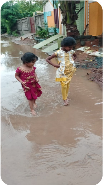
ఆంధ్ర ప్రగతి నందికొట్కూరు/ కాత్తపల్లి సెప్టెంబర్ 30: కాత్తపల్లి మండల కేంద్రం లో ఇందిరమ్మ కాలనీగా పిలువబడే దళిత కాలనీకి వర్షాకాలం వచ్చిందంటే రోగాలమయంతో కాలనీ లోని చిన్నపిల్లలు మొదలుకొని వయోవృద్ధులు వరకు టైఫాయిడ్, మలేరియా, డెంగ్యూ, జ్వరాలతో పాటు, చర్మ సంబంధ వ్యాధులు తో కాలనీ వాసులు తీవ్ర ఇబ్బందులు ఎదుర్కొంటూ దినసరి కూలీ మీద వచ్చే ఆదాయం మొత్తం ఆసుపత్రుల లో వైద్య

-ఫిర్యాదు దారుణంగా సమస్య పరిష్కారం అయిందని సంతకం పెట్టాలని అధికారులు ఒత్తిడి.