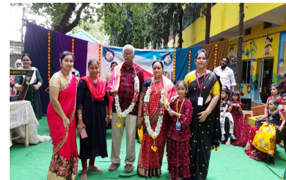
ఉపయోగపడతాయి. పెద్దలు, పిల్లలకు చెప్పే కథలు, నీతులు, పద్ధతులు నైతిక విలువలు పిల్లల సర్వతో ముఖాభివృద్ధికి దోహదపడతాయి. అలాంటి పెద్దల ఆశీస్సులు మనందరికీ శ్రీ రామరక్ష " అంటూ పెద్దల గురించి విలువలతో కూడిన విషయాలను తెలియజేశారు. యజమాన్యం వారు వచ్చిన గ్రాండ్ పేరెంట్స్ కు ఘనంగా సన్మానించారు

కీలక పాత్ర వహిస్తుంది. అలాంటి వ్యవస్థ లో ఉమ్మడి కుటుంబం అతి ముఖ్యమైనది తాతయ్య, నానమ్మ, అమ్మ, నాన్న, పిన్ని, బాబాయి, వారి పిల్లలు ఇలా అందరూ కలిసి ఉండేదే ఉమ్మడి కుటుంబం ఇంట్లోని పెద్దల అనుభవాల్లో మనకు జీవిత పాఠాలు వారు ఇచ్చే సలహాలు, సూచనలు మనం కోరుకున్న గమ్యాన్ని సూచించగల దిక్సూచి లాంటివి "అసలు కంటే వడ్డీయే ముద్దు" "కదా అంటే పెద్దవాళ్ళకు తమ పిల్లల కంటే మనవల్లతోనే ఎక్కువ అనుబంధం ఉంటుంది". తాత - మనుషుల ప్రేమ, వారి ముచ్చట్లు, సరదాలు, తమాషాలు పిల్లల్లో ఆత్మస్వేచ్ఛాన్ని, బలాన్ని పెంచుతాయి. ప్రతి కుటుంబంలో ఎదురయ్యే ఆర్థిక, మానసిక, శారీరక సమస్యలు ఎదురైనప్పుడు వారు అందించే సలహాలు ఎంతో