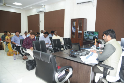
జగనన్న ఆరోగ్య సురక్ష క్యాంపుల్లో గుర్తించిన కొత్త వ్యాధులకు ఖచ్చితమైన ట్రీట్మెంట్ ఇవ్వండి.