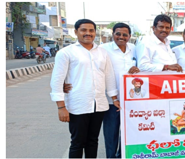
సంప్రదాయం ప్రకారం భోగి బండారు కార్యక్రమం నిర్వహించిన తర్వాతనే హాధిరాం బాలాజీ దర్శనం చేసుకుంటారు ఇది చరిత్ర. బంజారా సంప్రదాయం నేడు పాలక వర్గం వమ్ముచేస్తున్నారు మా హాధిరాం మఠానికి సంబంధించిన ఎన్నో ఎకరాలు భూమి అన్యకాంతం అవుతుంది అక్కడ అగ్రస్థానంలో ఉన్న నాయకులు దళారీ వ్యవస్థ ఆ భూములలో గుడిసెలు వేసుకోన్నారు. మరి కొందరు అమ్ముకుంటున్నారు. సుగాలీలా లంబాడీల బంజారాల సంబంధించి ప్రజా సంఘా అందరు ఎకమై హాధిరాం మఠాన్ని కాపాడుకోవాలి