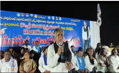
ఎస్సీ వర్గీకరణ బిల్లును ఎందుకు చేయడం లేదని డిమాండ్ చేశారు.

కల్పించాలన్నారు. సరేంద్ర మోడీ బిజెపి ప్రభుత్వం జీఎస్టీ, మహిళా తదితర బిల్లులను వెంటనే ఆమోదించి చేస్తున్నారు. ఎస్సీ వర్గీకరణ బిల్లును ఎందుకు చేయడం లేదని డిమాండ్ చేశారు. రాంచందర్ కమిషన్ ఎస్సీ వర్గీకరణ చేయకపోతే వారికి అన్యాయం జరుగుతుంది అని చెప్పారు. కమిషన్ చెప్పిన ఎందుకు చేయడం లేదన్నారు. 58 ఏళ్లుగా అన్ని పార్టీలు ఎస్సీలకు అన్యాయం చేస్తున్నాయి ముమ్మల్ని పట్టించుకోవడం లేదని విమర్శించారు. 2017 లో సీఎం కేసీఆర్ కూడా అఖిలపక్షాన్ని ఢిల్లీకి తీసుకెళ్ళామన్నారు గాని ఇంతవరకు తీసుకెళ్ళ లేదన్నారు. ఈ పార్లమెంట్ సమావేశాల్లో ఎస్సీ