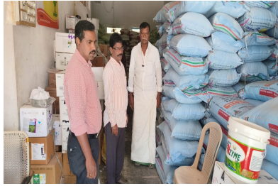
మెషిన్ లో మరియు ఫిజికల్ స్టాక్ రిజిస్టర్ స్టాక్ లు సమానంగా వుండాలని, అలాగే ఎరువులు కృత్రిమ కొరత సృష్టించి గరిష్ట చిల్లర ధర కన్నా ఎక్కువైనా ఎక్కువగా అమ్మితే వారిపై ఎఫ్ సి ఓ 1985 ప్రకారం చర్యలు తీసుకుంటామని తెలియజేశారు.