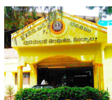
తగ్గించుకోవడానికి, ప్రభుత్వానికి ఆదాయం కోసం ఇప్పటికే కొందరిని నియమించినట్లు సమాచారం. నంద్యాల మున్సిపల్ టౌన్ ప్లానింగ్ లో ఆ అదృష్టవంతులు ఎవరో తెలియాల్సి ఉంది

నేపథ్యంలోనే ప్రభుత్వం సచివాలయం లో పని చేస్తున్న ఫ్లానింగ్ సెక్రెటరీ లకు తీపి కబురు చెప్పింది. కార్పొరేషన్, మున్సిపాలిటీ లో పని చేస్తున్న ఫ్లానింగ్ సెక్రెటరీ లో అర్హత కలిగిన నలుగురికి బిల్డింగ్ ఇన్స్పెక్టర్ గా తీసుకోవచ్చని ప్రభుత్వం జీడి ఇచ్చింది. నంద్యాలలో 42 వార్డుల్లో 42 మంది ఫ్లానింగ్ సెక్రెటరీ లు పని చేస్తున్నారు. నేతలు, అధికారులు 42 మందిలో ఆ నలుగురు అదృష్టవంతులు ఎవరో తెలియాల్సివుంది. ప్రజా ప్రతినిధులు, అధికారులు ఆలస్యం చేయకుండా నలుగురికి అవకాశం కల్పిస్తే పట్టణంలోని ఆక్రమ కట్టడాలను అరికట్టడంలో ప్రభుత్వానికి ఆదాయం లభిస్తుంది. ప్రభుత్వం జీడి ఇచ్చి రెండునెలలు గడుస్తున్నా దేవుడు పరమిచ్చినా పూజారి కరునించడం లేదన్న సామెత గుర్తుకు వస్తుంది. రాష్ట్రంలోని కొన్ని ప్రాంతాల్లో పని భారం