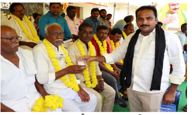
ఆదుకుంటుందని నాగేశ్వరరావు తెలిపారు. టీడీపీ శ్రేణులపైకి పోలీసులను ఉసిగొలిపి, జగన్మోహన్ రెడ్డి బెదిరింపులకు గురి చేస్తున్నారని మండిపడ్డారు. మరోవైపు సైక్ చెప్పిందల్లా చేయాల్సి వస్తుందంటూ పోలీసులు లోలోపల మదన పడుతున్నారని నాగేశ్వరరావు అన్నారు. అసలు పనే జరగని అమరావతి రింగురోడ్డు విషయంలో, లోకేష్ ని జైలుకు పంపేందుకు జగన్మోహన్ రెడ్డి కుట్ర చేస్తున్నారని అన్నారు. ప్రతి ఎన్నికల సమయంలో కొన్ని సామాజిక వర్గాల మధ్య చిచ్చుపెట్టి, లబ్ధి పొందడం స్థానిక శాసనసభ్యుడికి బాగా అలవాటని నాగేశ్వరరావు విమర్శించారు. ఈసారి కూడా అలాంటి జిత్తులమారి షాస్తూ ఆయన మళ్ళీ మొదలుపెట్టినట్లు అర్థమవుతోందని, కానీ ఈసారి ప్రజలు సమ్మతించారని అన్నారు. అలాంటి కుట్ర రాజకీయాలు తమకు తెలియన్నారు. కులాల మధ్య గొడవలు సృష్టించే పనికిమాలిన రాజకీయాలు ఇకనైనా మానుకోవాలని వైసీపీ నేతలను