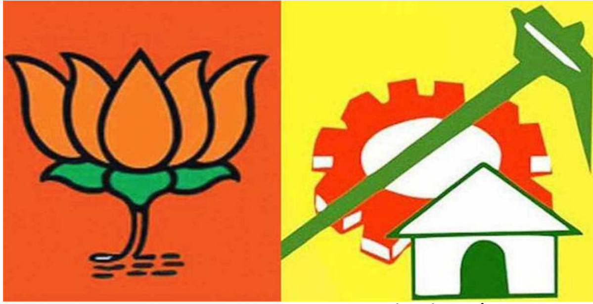
ఆ 'అసమర్థుడి' ముద్ర నుంచి బయటపడుతున్నారు. కాంగ్రెస్ విషయంలో అనుకున్న ఫలితాలను సాధించిన బీజేపీ.. దేశంలో బలంగా ఉన్న ప్రాంతీయపార్టీలను బలహీనపర్చటంపై రెండోదశలో దృష్టి పెట్టింది.

బీజేపీ దృష్టి బీడీపీ పై పడిందా..? ఆంధ్ర ప్రగతి అమరావతి అక్టోబర్ 11: మాజీ ముఖ్యమంత్రి చంద్రబాబు అరెస్టు వెనుక ఏపీ సీఎం జగన్మోహన్ రెడ్డి అన్న ఉందని అందుకు పరోక్షంగా కేంద్రంలోని మోదీ సర్కార్ అండ, సహకారం లేకుండా ఏపీ ప్రభుత్వం ఈ పని చేయగలుగుతుందా అన్న అనుమానాలు ప్రజల్లో బలంగా ఉన్నాయి. దేశంలో ప్రాంతీయ పార్టీలను బలహీనపరిచి వాటి ఉనికి లేకుండా చేయాలన్న వ్యూహంలో భాగంగా బీజేపీ దృష్టి తెలుగుదేశం పై పడిందా? అన్న అనుమానాలు కలవక మానదు. కేంద్రంలో ప్రధానిగా మోదీ అధికారంలోకి వచ్చిన తర్వాత కాంగ్రెస్ను బలహీనపరచటంపై దృష్టి సారించింది. కాంగ్రెస్ ముక్త భారత్ అనే నినాదాన్ని ఇచ్చింది. ఆ దిశగా గణనీయమైన విజయాలు సాధించింది. కాంగ్రెస్కు లోకసభలో ప్రతిపక్ష హోదాకు అవసరమైనన్ని సీట్లు కూడా రాకుండా ఎన్నికల రణరంగంలో చిత్తుగా ఓడించగలిగింది. రాహుల్ గాంధీని అసమర్థుడిగా చిత్రీకరించే ప్రచారవ్యూహాన్ని విజయవంతంగా అమలు చేసింది. ఈ తొమ్మిదేళ్లకాలంలో అనేక అపహాస్యాలను, ఆన్ లైన్ ట్రోలింగులను ఎదుర్కొన్న రాహుల్ గాంధీ ఇప్పుడిప్పుడే