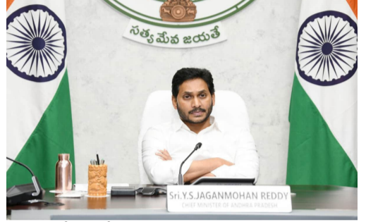
కానప్పటికీ పిటిషన్ దాఖలు చేయవచ్చని ఎంపీ రఘురామ తరపు సీనియర్ న్యాయవాది కోర్టుకు తెలిపారు. అయితే మూడో వ్యక్తి ఎందుకు పిటిషన్ వేశారని ధర్మాసనం ప్రశ్నించింది. ప్రతిపక్ష పార్టీకి సంబంధించిన వ్యక్తి కూడా అని కోర్టు అడుగగా ఎంపీ రఘురామ కూడా వైసీపీ ఎంపీనే అని ఎంపీ తరపు న్యాయవాది సుప్రీంకోర్టుకు తెలియజేశారు.

చేసింది. జగన్ కేసుల విచారణను వేరే రాష్ట్రానికి మార్చాలని ఎంపీ రఘురామ సుప్రీంలో పిటిషన్ వేశారు. జగన్ కేసులపై సుప్రీంలో ఎంపీ పిటిషన్ దాఖలు చేశారు. తెలంగాణ సీబీఐ కోర్టులో జగన్ కేసులపై వివరీతమైన జాబ్బులు జరుగుతుందని.. 3071 సార్లు జగన్ కేసును సీబీఐ కోర్టు వాయిదా వేసినట్లు పిటిషన్లో పేర్కొన్నారు. జగన్ ప్రత్యక్ష హాజరుకు కూడా సీబీఐ కోర్టు మినహాయింపు ఇచ్చిందన్నారు. వందల కొద్దీ డిస్కార్డ్ పిటిషన్లు వేసినట్లు పిటిషన్లో పేర్కొన్నారు. అయితే రఘురామ పిటిషన్పై సుప్రీం పలు ప్రశ్నలు సంధించింది. జగన్ అక్రమాస్తుల కేసుకు ఎంపీ రఘురామకు ఏమిటి సంబంధమని కోర్టు ప్రశ్నించింది. ఎంపీ రఘురామ ఫిర్యాదుదారు కాదని.. బాధితుడు కూడా కానప్పుడు ఆయనెందుకు పిటిషన్ వేశారని సుప్రీం ధర్మాసనం అడిగింది. ఫిర్యాదుదారు