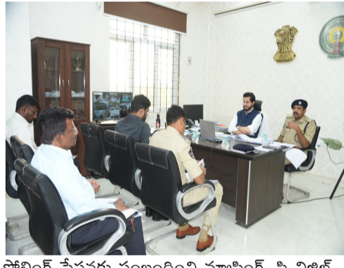
పోలింగ్ స్టేషన్లకు సంబంధించి మ్యూపింగ్, సి విజిల్, అసెంబ్లీ నియోజకవర్గాల వారీగా కమ్యూనికేషన్ ప్లాన్, తదితర అంశాలను సమగ్రంగా వివరించారు. ప్రత్యేక ఓటర్ జాబితా సవరణ పోలింగ్ స్టేషన్ రేషన్లైజేషన్ తదితర అంశాలపై ప్రతివారం గుర్తింపు పొందిన రాజకీయ పార్టీల ప్రతినిధులతో సమావేశం నిర్వహించి వారి సూచనలను పరిగణనలోకి తీసుకొని ఎన్నికల కమిషన్కు ప్రతిపాదనలు సమర్పించామన్నారు.