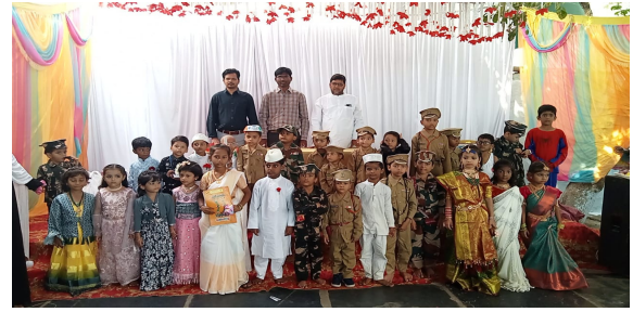
మాస్టర్ పబ్లిక్ స్కూల్లో ఘనంగా జరిగిన బాలల దినోత్సవం.