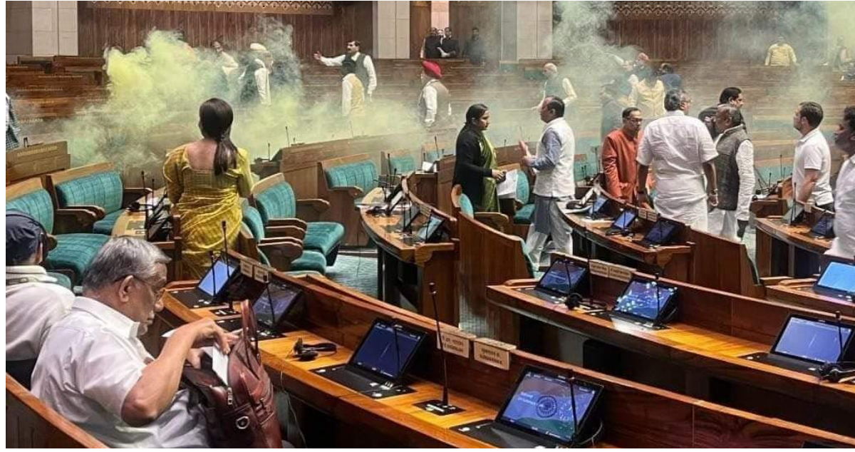
లోక్ సభలో ఇద్దరు దుండగుల