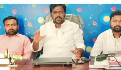
అందువలన తక్షణమే నంద్యాల, కర్నూలు జిల్లాలలోని జనవరిలో జరిగే ఏ.ఎన్.యూ దూరవిద్య పరీక్షలకు ప్రైవేట్ సెంటర్లను ఎత్తివేసి ప్రభుత్వ కళాశాలలో నిర్వహించి, విద్యార్థులు - యువత - నిరుద్యోగుల జీవితాలను కాపాడాలని వారు కోరారు. లేదంటే విద్యార్థులను, యువతను, నిరుద్యోగులను సమీకరించి ఫలో ఏ.ఎన్.యూ ముట్టడికి పిలుపునిస్తామని వారు తెలిపారు.

పరీక్షలు జరిగిన సందర్భంలో ఉమ్మడి నంద్యాల, కర్నూలు జిల్లాలలోని అన్ని ప్రైవేట్ కేంద్రాల నిర్వాహకులు విద్యార్థులు, యువత నుండి వారిని మళ్ళపెట్టి యూనివర్సిటీ ఫీజులు - పరీక్ష ఫీజులు కాకుండా, రకరకాల పేర్లతో 15వేల నుండి 30వేల రూపాయలు వసూళ్లు చేసుకొని జేబులు నింపుకున్నారుని వారు మండిపడ్డారు. అలాగే కొంతమంది ఈ ప్రైవేట్ దూరవిద్య సెంటర్లలో పరీక్ష ఫీజులు చెల్లించి, యాజమాన్యానికి భారీ మొదలుపులు చెల్లించి వారు పరీక్షలు వ్రాయకుండా ఇతరులతో (బ్రై క్యాండ్లెట్లు) పరీక్షలు వ్రాసిన ఉదంతాలు ఎన్నో కోకొల్లలుగా జరిగాయన్నారు. కొంతమంది ప్రైవేట్ సెంటర్ల యాజమాన్యం ఈ పరీక్షలను పరీక్షలుగా కాకుండా - వ్యాపార పంథాలో చూస్తూ లక్షల రూపాయలు వసూళ్లు చేస్తూ విద్యార్థులను - నిరుద్యోగులను తీవ్ర మోసం చేస్తున్నారని వారు మండిపడ్డారు.