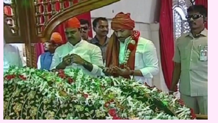
కడప పెద్ద దర్గా ఉరుసులో పాల్గొన్న ముఖ్యమంత్రి జగన్