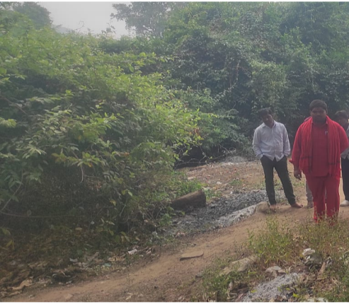
కాలం పడుతుంది అన్నారు. అడవి ప్రాంతంలో ప్లాస్టిక్ వ్యర్థాలు పేరుకపోవడం వల్ల వర్షపు నీరు భూమిలో ఇంకిపోకుండా వాగులు వంకల ద్వారా నిరుపయోగంగా పోతుంది అన్నారు. అంతేకాక ఇలాంటి ప్లాస్టిక్ వ్యర్థాలని వర్షాకాలంలో వాగులు వంకల ద్వారా కొట్టుకొని వచ్చి వరద నీరు గ్రామాలను వట్టణాలను ముంచెత్తడంతోపాటు కాలువలు చెరువులు తెగిపోయిన సందర్భాలు