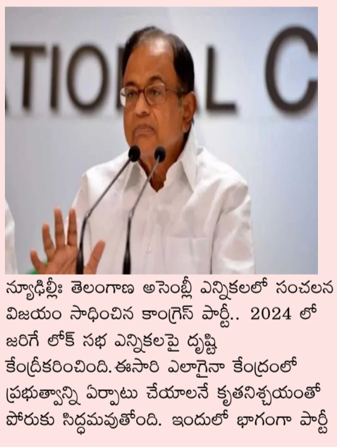
స్వాధీనీ తెలంగాణ అసెంబ్లీ ఎన్నికలలో సంచలన విజయం సాధించిన కాంగ్రెస్ పార్టీ.. 2024 లో జరిగే లోక్ సభ ఎన్నికలపై దృష్టి కేంద్రీకరించింది. ఈసారి ఎలాగైనా కేంద్రంలో ప్రభుత్వాన్ని ఏర్పాటు చేయాలనే కృతనిశ్చయంతో పోరుకు సిద్ధమవుతోంది. ఇందులో భాగంగా పార్టీ

మహిళలకు ఉచిత బస్సు ప్రయాణం ఆంశంపై హామీ ఇచ్చారు. దాంతో జగన్ ప్రభుత్వం అప్రమత్తం అయ్యింది. ఈ హామీని ముందగానే అమలు చేసే యోచనలో ఉన్నట్లు సమాచారం. అందుకోసం సీఎం జగన్ అధికారులతో.. ఉచిత ప్రయాణం అమలు చేస్తే ఆర్టీసీ రాబడి ఎంత తగ్గుతుంది? ప్రభుత్వం ఎంత చెల్లించాల్సి వస్తుంది.. పొరుగు రాష్ట్రాలు ఏ నిబంధనలతో అమలు చేశాయి.. అన్న అంశాలపై అధికారులతో చర్చిస్తున్నారు. సంక్రాంతి పండుగ నుంచే ఈ పథకాన్ని అమలులోకి తీసుకొచ్చేందుకు జగన్ ప్రభుత్వం ప్రయత్నిస్తోందని తెలుస్తుంది. పల్లెవెలుగు, ఎక్స్ ప్రెస్, విశాఖపట్నం, విజయవాడలోని సిటీ సర్కిళ్లలో ఉచిత ప్రయాణం అమలు చేయాలని అనుకుంటున్నట్లు సమాచారం. ఏపీలో ప్రస్తుతం ఆర్టీసీ బస్సుల్లో నిత్యం 40 లక్షల మంది ప్రయాణిస్తున్నారు. అందులో 15 లక్షల మంది మహిళలు ప్రయాణం చేస్తున్నారు. 10 లక్షల వరకు బస్ పాస్ లు కలిగినవారు ఉన్నారు. 3 నుంచి 4 లక్షల వరకు విద్యార్థినులు ప్రయాణిస్తున్నారు. ఏపీఎస్ఆర్టీసీకి రోజుకు సగటున రూ. 17 కోట్ల ఆదాయం వస్తోంది.