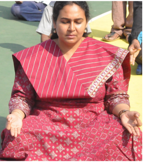
జరుగుతుందని అందులో భాగంగా 22 వ తేదీ టెన్నిస్కోయట్, ఈరోజు యోగ కార్యక్రమం