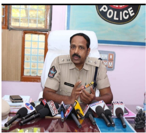
అభ్యంతరమైన, అసభ్యకరమైన అంశాలు పోస్ట్ చేయరాదన్నారు.

చర్యలును తీసుకుంటున్నామని, పోలీసులకు సహకరించాలని సూచించారు. పెట్రోలింగ్ ముమ్మరం చేస్తామని వివరించారు. ప్రత్యేక పోలీసు బృందాలను నియమిస్తామని అన్నారు. నూతన సంవత్సర వేడుకలను పురస్కరించుకొని పాటించాల్సిన నిబంధనలను ఆయన ప్రజలకు వివరించారు. 31వ తేదీన రాత్రి 01 గంటల తరువాత ప్రజల గుంపులు గుంపులు తిరగడం కానీ, ఒకే ప్రదేశంలో ఉండడం కానీ చేయకూడదన్నారు. రాత్రి వాహనాల తనిఖీలు ఉంటుందని, మద్యం సేవించడం గాని ముగ్గురు వ్యక్తులు ప్రయాణించడం గానీ, నేషనల్ హైవే పై బైక్ రేస్ చేయడం చేస్తే అలాంటి వారిపై కేసులు నమోదు చేయడం జరుగుతుందన్నారు. నూతన సంవత్సరం సందర్భంగా ఎటువంటి కేక్ కటింగ్ కార్యక్రమాలు వీధులలో లేదా రోడ్లపై చేయకూడదన్నారు. కేక్ కటింగ్ చేయాలనుకునే వారు తమ తమ ఇళ్లలోనే వారి కుటుంబ సభ్యులతో నూతన సంవత్సరం వేడుకలు జరుపుకోవాలని సూచించారు. ఎటువంటి ఎంటర్టైన్మెంట్ కార్యక్రమాలు పబ్లిక్, ప్రైవేట్ ప్రదేశాలలో నడుపుటకు అనుమతి లేదన్నారు. ఏదేని కార్యక్రమాలు చేయటం ముందస్తుగా పోలీసులకు తెలియజేయాలి. తేనికో చట్ట రీత్యా చర్యలు తీసుకుంటామన్నారు. పోలీస్ లవే రాత్రిళ్ళు గస్తీ నిర్వహిస్తామని, సోషల్ మీడియా లో