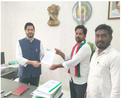
ప్రభుత్వ సంస్థల బోర్డులపై తెలుగు, ఇంగ్లీషు భాషలతో పాటు ఉర్దూ భాషలో కూడా ప్రభుత్వ కార్యాలయాల పేర్లు ఉండేలా చర్యలు తీసుకోవడం ద్వారా ఆంధ్రప్రదేశ్ రాష్ట్ర రెండవ అధికార భాష అయిన ఉర్దూ భాషకు న్యాయం చేసినట్లు ఉంటుంది మరియు ఉర్దూలో చదివే జిల్లా ప్రజలకు కూడా వారి యొక్క సమాచారం ప్రభుత్వ కార్యాలయాల ద్వారా తెలుసుకోవడానికి అనుకూలంగా ఉంటుందని తెలియజేశారు.

సంద్యాలలో చాలా ఎక్కువ అలాంటి మన సంద్యాల జిల్లాలో ఉర్దూ భాషను రెండవ అధికార భాషగా ప్రకటించినప్పటి కూడా ప్రజలకు ప్రభుత్వానికి మధ్య వారధి లెక్క ఉండి కీలక పాత్ర పోషిస్తూ ప్రజలకు సేవలు అందిస్తున్న ప్రభుత్వ కార్యాలయాలు అయిన పోలీస్ స్టేషన్లు, ఎమ్మార్వో కార్యాలయాలు, ఆర్టీవో కార్యాలయాలు, ప్రభుత్వ కళాశాలలు, ప్రభుత్వ వైద్యశాలలు మరియు ప్రభుత్వ పాఠశాలలతో సహా అనేక ముఖ్యమైన ప్రభుత్వ కార్యాలయాల పేర్లు ఆంధ్రప్రదేశ్ రాష్ట్ర రెండవ అధికార భాష అయిన ఉర్దూ లో లేవని మా ధృష్టికి వచ్చాయి. ప్రధానంగా తెలుగు మరియు ఆంగ్లంలో మాత్రమే ప్రదర్శించబడుతుంది. ఆంధ్రప్రదేశ్ రాష్ట్ర రెండవ అధికార భాష అయిన ఉర్దూ భాష ప్రభుత్వ కార్యాలయాల పేర్లు లేకపోవడం ఒక రకమైన సామాజిక అన్యాయంగా పరిగణించబడుతుంది, ఎందుకంటే ఇది మన జనాభాలో గణనీయమైన భాగానికి అడ్డంకులు సృష్టించవచ్చు. ప్రజలకు అవసరమైన సేవలు మరియు సమాచారానికి అడ్డుకుంటుంది. కావున మా సంద్యాల జిల్లాలోని