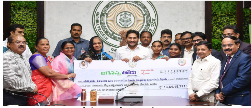
ఆధారపడకుండా స్వయం ఉపాధితో జీవిస్తూ, మరో అధిక వడ్డీల బారిన పడకుండా వారికి ప్రభుత్వం ఒకరిద్దరికీ సైతం ఉపాధి కల్పిస్తున్న చిరు వ్యాపారులు అండగా నిలుస్తోందని చెప్పారు.

ఆంధ్ర ప్రగతి తాడేపల్లి జనవరి 11: నిరుపేదలైన చిరు వ్యాపారులు, హస్త కళాకారులు, సంప్రదాయ చేతి వృత్తుల వారు వారి కాళ్ల మీద వారు నిలబోకుండానేలా రాష్ట్ర ప్రభుత్వం అమలు చేస్తున్న జగన్ న్న తోడు పథకం దేశానికి దిక్పాతానిగా నిలిచింది అని సీఎం జగన్ పేర్కొన్నారు. 'జగన్ న్న తోడు' 8వ విడత నిధులు రూ.431.58 కోట్లను సీఎం జగన్ ముఖ్యమంత్రి క్యాంపు కార్యాలయం నుంచి బటన్ నొక్కి లభించారుల బ్యాంకు ఖాతాల్లో జమ చేశారు. ఒక్కొక్కరికి ఏటా రూ. 10 వేల రుణం సున్నా వడ్డీకే అందిస్తున్నామని, రుణాలను సకాలంలో చెల్లించినవారికి ఏడాదికి మరో రూ.1,000 చొప్పున జోడిస్తూ రూ.13,000 వరకు వడ్డీలేని రుణం అందిస్తున్నామని తెలిపారు. ఇతరులపై