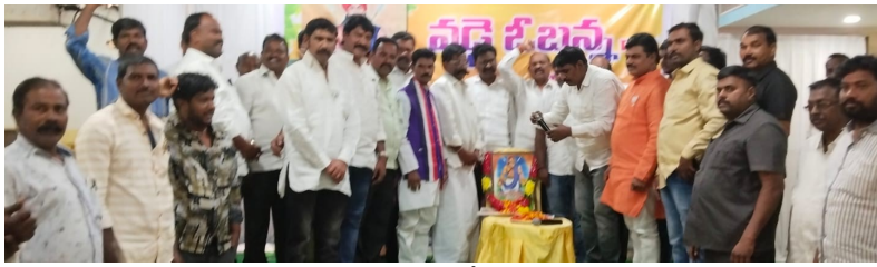
ఆంధ్ర ప్రగతి నంద్యాల జనవరి 11:

నంద్యాల పట్టణంలోని సూరజ్ గ్రాండ్ ఫంక్షన్ హాల్ నందు నంద్యాల వడ్డే సంఘము జిల్లా ముఖ్య నాయకులు రాష్ట్ర నాయకులు సమావేశం జరుపుకొని జన్మదిన వేడుకలు ఘనంగా జరుపుకోవడం జరిగింది. ఈ కార్యక్రమానికి జిల్లా సములాల నుంచి వడ్డే సంఘ నాయకులు అధిక సంఖ్యలో పాల్గొని విజయవంతం చేసినారు. జిల్లా అధ్యక్షులు చక్రవర్తి అధ్యక్షతన జిల్లా నాయకులు రాష్ట్ర నాయకులు మాట్లాడుతూ.. వడ్డే ఓబన్న జయంతిని రాజోయే సంవత్సరం నుంచి ప్రభుత్వ అధికార లాంచనాలతో జరపాలని నాయకులు డిమాండ్ చేయడం జరిగింది. ప్రభుత్వం తరపున స్టం కేటాయించి ఒక కమిటీ హాల్ లో కూడా ఏర్పాటు చేయాలని కోరడం జరిగింది. వడ్డేలను ఎస్ఐ జాబితాలో చేర్చాలని గత 30 సంవత్సరాల నుంచి పోరాడుతున్న వడ్డే కోరిక ఎస్ఐ సాధన ను పార్టీలు, ప్రభుత్వాలను చేర్చాలని విజ్ఞప్తి చేయడం జరిగింది. రాజకీయంగా సామాజికంగా, వడ్డేలను ఆర్థికంగా ఎదగాలంటే జనాభా ప్రాతిపదికంగా వడ్డేలకు ఎమ్మెల్యే మరియు ఎంపీ సీట్లను కేటాయించాలి వడ్డేల కార్యారేషన్ కు నిధులు సమకూర్చాలి. వడ్డేలకు ప్రమాద బీమాను మరియు పింఛన్ సౌకర్యాన్ని కల్పించాలి.