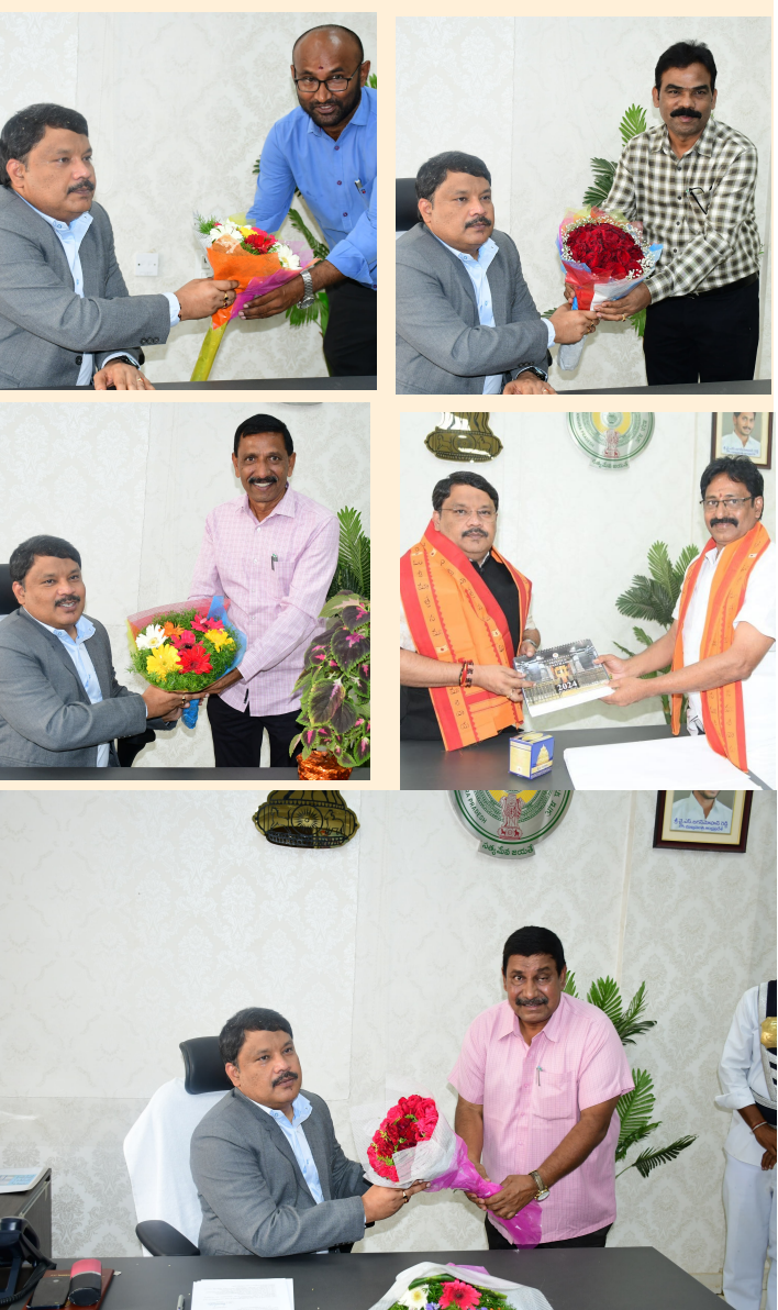
వేదమంత్రాల మధ్య జిల్లా కలెక్టర్ పదవి బాధ్యతలు చేపట్టారు. ఈ సందర్భంగా కలెక్టరేట్ ఛాంబర్ లో పలువురు జిల్లా అధికారులు అభినందించారు.