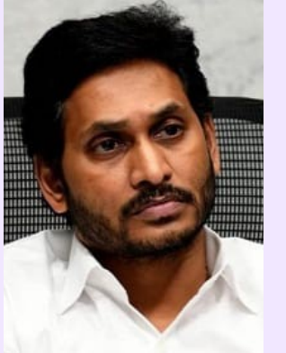
చెప్పలేకపోయారు. ఐదేళ్ల పాటు పరిపాలన చేసి.. నేను ఫలానా ఘనత సాధించానని చెప్పుకుని ఎన్నికలకు వెళ్లారు. కానీ జగన్ రెడ్డి.. గత ప్రభుత్వాన్ని.. కోవిడ్ ను 98% రాష్ట్ర విభజనను చంద్రబాబును బూచిగా చూపెట్టేందుకు ప్రయత్నించారు. పైగా పొత్తులు పెట్టుకున్నారు.. ఏడుపులు కూడా ఉన్నాయి. రాజకీయాంగా వేరే పార్టీల వ్యూహాల గురించి అసెంబ్లీలో జగన్ రెడ్డి చెప్పాల్సిన అవసరం లేదు. కానీ ఆయన నిరాశ నిస్సహాయత ఉన్నట్లుగా ఉన్నారు. బహిరంగసభల్లో చెప్పే ప్రసంగాలనే అటూ ఇటూగా మళ్లీ అసెంబ్లీలో చదివి వినిపించారు.

ఆంధ్ర ప్రగతి అమరావతి ఫిబ్రవరి 06: ఏపీ అసెంబ్లీలో జగన్ రెడ్డి ప్రసంగించారు. ఎన్నికలకు ముందు చివరి అసెంబ్లీ సమావేశాలు కావడంతో ఆయన తన పాలనా తీరును ఎలా సమర్థించుకుంటారా అని అందరూ ఆసక్తిగా చూశారు. కానీ ఆయన కరోనా వల్ల నష్టపోయామని.. ప్రతీ రాష్ట్రానికి ఓ పవర్ హౌస్ లా ఉండే మహానగరం లేకపోవడం వల్ల ఇంకా నష్టపోయామని అందు వల్ల ఏమీ చేయలేకపోయామన్నట్లుగా వివరణ ఇచ్చారు. ఈ ప్రసంగం విని వైసీపీ ఎమ్మెల్యేలకు మైండ్ బ్లాంక్ అయింది. ఎక్కడైనా బిల్లులు చరిచి చప్పట్లు కొడదామన్నా చాన్సివ్వకుండా.. ఐదేళ్ల తన చేతకాని తానికి కారణాలు చెప్పుకుంటూ పోయారు. ఇంకా విశేషం ఏమిటంటే మూడు రాజధానులు చేస్తానని.. విశాఖను ఎగ్జిక్యూటివ్ క్యాపిటల్ చేస్తానని ఆయన చెప్పలేదు. ప్రతీ రాష్ట్రానికి ఓ పవర్ హౌస్ ఉండాలని.. అలాంటి పవర్ హౌస్ విశాఖ అవుతుందని ఎక్కువ సార్లు ప్రస్తావించానని చెప్పకొచ్చారు. ఐదేళ్లలో విశాఖకు ఏం చేశారో.. మాత్రం చెప్పలేదు. ఆదాయం పెరగలేదని పదే పదే తన చేతకాని తనానికి కారణంగా చెప్పారు కానీ.. ఎందుకు పెరగలేదో మాత్రం చెప్పలేదు. గత ప్రభుత్వ ఆర్థిక విధానాలంటూ.. కోవిడ్ అంటూ.. మరొకటి అంటూ.. అంతే తప్ప.. తాను సాధించిన ఏమిటన్నది మాత్రం