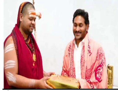
జోష్యానికి కాస్త ఇబ్బందులు వచ్చాయి. ఈ నేపథ్యంలో రెండోసారి అధికారంలోకి రావాలనుకుంటున్న జగన్ 98% స్వామిజీని నమ్ముతారా? నమ్మితే వార్షికోత్సవ వేడుకలకు హాజరవుతారా? మరోసారి రాజస్వామల యాగాన్ని జరిపి.. అధికారాన్ని అందుకోగలరా? అన్నది చూడాలి.

రాజస్వామల యాగం నిర్వహించనున్నారని సమాచారం. అయితే వైసిపి అధికారంలోకి వచ్చిన తర్వాత సీఎం జగన్ ఈ వార్షికోత్సవ వేడుకలకు హాజరవుతూ వచ్చారు. ఈ ఏడాది కూడా హాజరు కావాలని నిర్ణయించుకున్నట్లు సమాచారం. శారదాపీఠం ఉత్తరాధికారి స్వామి నందేంద్ర స్వామి సీఎం జగన్ కు కలిసి ఆహ్వాన పత్రం అందించారు. అయితే ఈసారి జగన్ యాగానికి హాజరవుతారా? లేదా? అన్నది చూడాలి. కెసిఆర్ ముచ్చటగా మూడోసారి అధికారంలోకి వస్తారని స్వరూపానందేంద్ర స్వామి సెలవిచ్చారు. అటు స్వరూపానందేంద్ర స్వామికి సైతం కెసిఆర్ హైదరాబాద్లో ప్రత్యేక స్థానం ఇచ్చారు. కానీ స్వామి గారు చెప్పినట్లుగా కెసిఆర్ అధికారంలోకి రాలేకపోయారు. స్వామిజీ ఒకటా దీవిస్తే.. ప్రజలు మరోలా తీర్పు ఇచ్చారు. స్వరూపానందేంద్ర స్వామి ఆశీస్సులతో అధికారంలోకి వస్తారు అనుకున్న కెసిఆర్ ప్రగతి భవన్ ను వీధాల్ని వచ్చింది. దీంతో స్వామిజీ