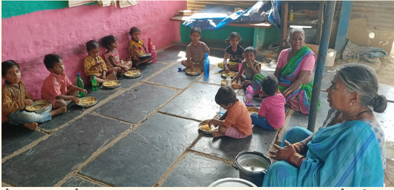
భోజన వసతి మాత్రమే కల్పిస్తున్నారు. గుడ్లు సరఫరా చేసే కాంట్రాక్టర్ తన ఇష్టానుసారంగా అంగన్వాడీ కేంద్రాలకు నాసిరకం కోడి గుడ్లను కూడా సరఫరా చేస్తున్నట్లు ఆలోచనలు ఉన్నాయి. అంగన్వాడీ అధికారులు మాత్రం గుడ్లు సరఫరా చేయకపోయినా కాంట్రాక్టర్లపై ఎటువంటి చర్యలు తీసుకోకపోవడం పట్ల పలువురు చిన్నారల తల్లిదండ్రులు ఆవేదన వ్యక్తం చేస్తున్నారు.

ఆంధ్ర ప్రగతి రుద్రవరం ఫిబ్రవరి 08: ప్రభుత్వము చిన్నారలకు ఆటపాటలతో విద్య నేర్పించడమే కాకుండా వారికి బలమైన పౌష్టిక ఆహారం అందించాలని లక్ష్యంతో అంగన్వాడీ కేంద్రాలకు పాలు గుడ్లు, చిక్కిలు ఇతర పౌష్టిక ఆహారాన్ని సరఫరా చేస్తుంది. అయితే ప్రభుత్వ ఆహారానికి గండి కొట్టి కొందరు కాంట్రాక్టర్లు ఇష్టానుసారంగా అంగన్వాడీ కేంద్రాలకు పౌష్టిక ఆహారాన్ని సరఫరా చేస్తున్నారు. ప్రతినెల 1వ తేదీ నుంచి పౌష్టిక ఆహారము చిన్నారలకు ఇవ్వాలి ఉండగా 8, తేదీ అయినప్పటికీ కొన్ని అంగన్వాడీ కేంద్రాలకు గుడ్ల సరఫరా కాలేదు. ఎల్ల వత్తుల, కోటకొండ, వీరవోలు, కొండమాయపల్లి, చిన్న కంబలూరు, పెద్ద కంబలూరు, కే కొత్తూరు, వెలగలపల్లి, ఆర్ కొత్తూరు, ముత్తలూరు, తోపాటు మరికొన్ని అంగన్వాడీ కేంద్రాలకు గుడ్లు సరఫరా చేయకపోవడంతో విద్యార్థులకు మెనూ ప్రకారం