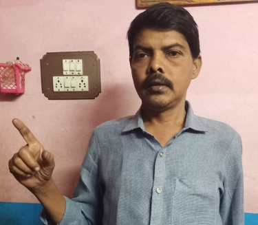
వారందరినీ చేర్చించుకుంటున్నారు. అంటే కార్యకర్తలు ఆనాడు మీకోసం కృషి చేసిన వాళ్లు సప్లయ్మెంట్ కదా ఇది అందరూ గమనిస్తున్నారు

ప్రాజెక్టుగా కేంద్రం బాధ్యత అని చెప్పే లేదు రాష్ట్ర ప్రభుత్వం ప్రత్యేకంగా కృషి చేస్తుంది నేను అక్కడనే రాత్రిపూట నిద్రపోయి పోలవరం ప్రాజెక్ట్ నిర్మిస్తానని చెప్పారు. ఆనాడు సిపిఎం సిపిఐ రాష్ట్ర నాయకులు మాజీ ఎమ్మెల్యేలు పోలవరం ప్రాజెక్టు వద్ద నిద్రపోవడం కాదు అందుకు కేంద్రం నుండి పోరాడి నిధులు సాధించాలని అలాగే రాష్ట్ర వ్యాప్తంగా ప్రాజెక్టుల నిర్మాణానికి పూర్తి చేయుటకు నిధులు కేంద్రం నుండి సాధించాలని విభజన చట్టంలోని అంశాలను అమలు చేయుటకు కేంద్రంలో పోరాడాలని తెలియజేస్తే నిరాకరించారు. ఆనాడు సిపిఎం సిపిఐ ఇతర వ్యతిరేకించడం లేదు కానీ మీరు చేసిన పనేమిటి మీరేం నేడు అక్కడ సీటు రాకపోవడం లేదా వ్యతిరేకం కావడం వల్ల మీ పార్టీలో వస్తుంటే