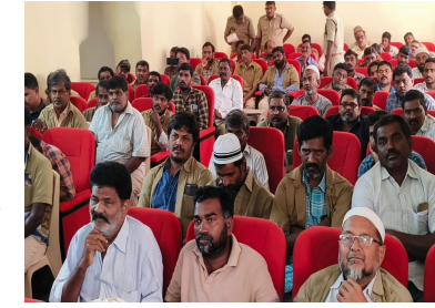
ప్రమాదం జరిగినప్పుడు తమ ప్రాణాలను కాపాడుకోవచ్చని , ప్రతి ఒక్కరూ వాహనాలకు ఇన్సూరెన్స్ , రిజిస్ట్రేషన్ సర్టిఫికేట్స్, డ్రైవింగ్ లైసెన్స్ మొదలగు ప్రమాదరక్షణ పత్రాలు తప్పనిసరిగా కలిగి ఉండాలని తెలియజేయడం జరిగింది.