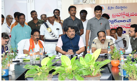
కల్పించడంతో పాటు సిబ్బంది మొత్తం అప్రమత్తంగా వుండి, భక్తులకు సేవలు అందించే కార్యక్రమంలో నిమగ్నం కావాలన్నారు.

మార్చి 1 నుండి 11వ తేదీ వరకు అత్యధిక సంఖ్యలో భక్తులు క్షేత్రానికి వచ్చే అవకాశం ఉన్నందున అదనపు సౌకర్యాలను