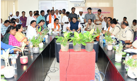
తీసుకోవాలని మత్యుశాఖ అధికారులను, దేవస్థానం పారిశుధ్య విభాగపు సహాయ కార్యనిర్వహణాధికారులను కలెక్టర్ ఆదేశించారు.

ప్రధానంగా క్యూలెన్సు, ట్రాన్సిట్ సదుపాయం, ట్రాఫిక్, వాహనాల పార్కింగ్, నిరంతర విద్యుత్ సరఫరా, పారిశుధ్యం తదితర అంశాలపై అప్పగించిన విధులపై ప్రత్యేక శ్రద్ధ పెట్టి నిర్వహించాలని సంబంధిత శాఖల అధికారులను కలెక్టర్ ఆదేశించారు. రద్దీ ప్రాంతాలలో ఉచిత వైద్యశిబిరాల్తో పాటు వైద్యనిపుణులు, అవసరమైన మందులను సిద్ధంగా ఉంచుకోవాలని డిఎంఆండ్ హెచ్.ఓ.ను ఆదేశించారు. అలాగే దోపిడీలను అరికట్టేందుకు ఫాగింగ్ మెటీరియల్ సిద్ధంగా ఉండాలని మలేరియా అధికారిని ఆదేశించారు. శ్రీశైలంలోని పిహెచ్.ఎస్, దేవస్థానం ఆసుపత్రి, సున్నిపెంటలోని వైద్యశాల, శ్రీశైలంలో ఏర్పాటు చేసే తాత్కాలిక 30 పడకల ఆసుపత్రి 24 గంటలపాటు నిర్వహించేలా వైద్యసిబ్బందిని కేటాయించాలని డి.ఎం. ఆండ్ హెచ్.ఓ.ను ఆదేశించారు. ముఖ్య ప్రదేశాలలో రెండు పిప్పలలో వైద్యులు విధులు నిర్వహించేలా చర్యలు తీసుకోవాలన్నారు. ఏడు 108 అంబులెన్సులు, పాదయాత్రమార్గములో ఒక అంబులెన్సును ఏర్పాటు చేయాలని సూచించారు. ప్రావ్యణికాట్యూరు నుండి శ్రీశైలం వరకు గతంలో సూచించిన విధంగా 31 ప్రదేశాలలో తాత్కాలిక వైద్యశిబిరాల్లను ఏర్పాటు చేయాలని కలెక్టర్ ఆదేశించారు. పాతాళగంగ, లింగాలగట్టు ప్రాంతాలలో పుణ్యస్నానాలాచరించేందుకు అనుమతిస్తున్నామని, ఇందుకు ప్రతిపాదించిన గజ ఈతనిపుణులు, అవసరమైన లైఫ్ జాకెట్లు, పుట్టిలు, తాత్కాలిక టాయలెట్లు, డ్రస్టింగ్ గదులు ఏర్పాటు చేసుకునేలా చర్యలు