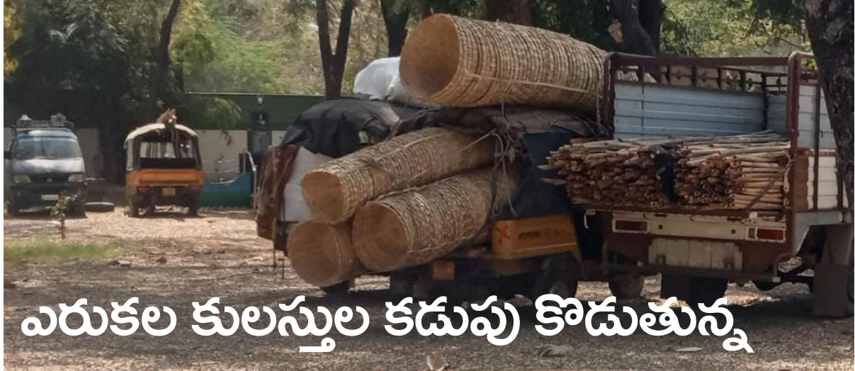
ఎరుకల కులస్తుల కడుపు కొడుతున్న