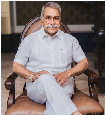
పోటీచేసే విజయం సాధిస్తే ప్రజా సమస్యలను సభ దృష్టికి తెగలనని కుండా బద్దలు కొట్టి చెబుతున్నారు. ఆళ్లగడ్డ నియోజకవర్గంలో పాటు పార్లమెంట్ పరిధిలోని నందికొట్కూర్, శ్రీశైలం, బనగానపల్లె, నంద్యాల, డోన్, పాణ్యం నియోజకవర్గాల్లో బలమైన రాజకీయ నాయకులతో సంబంధాలు ఉన్నాయి.