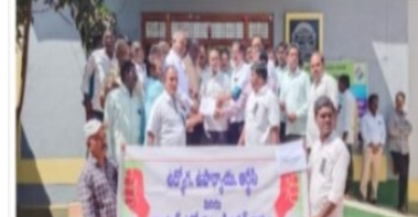
కష్టాలు ఇబ్బందులు పడతారన్న ఆవుట్ సోర్సింగ్ ఉద్యోగుల సమస్యలను విషయం అందరికీ తెలిసిన విషయమే. పరిష్కారించకపోతే ఉద్యమాలకు ఉద్ధ్యుల బుధవారం కర్నూలు జిల్లాలోని నియోజకవర్గ చేస్తామని హెచ్చరించారు. కార్యక్రమంలో డీవర్స్ కేంద్రమైన పత్తికొండ పట్టణంలో జేపీసీ ఫెడరేషన్ సంఘాల నాయకులు ఎస్టియూ అధ్యక్షులు నిరసన ర్యాలీ కార్యక్రమాన్ని యుటిఎఫ్ ఏపీటిఎఫ్ పిఆర్డీయూ ఏపీఎస్సీవో విజయ వంతంగా నిర్వహించారు. రాష్ట్ర జేపీసీ పింఛనలను సంఘం నాయకులు టి ఎంపి పిలుపు మేరకు నియోజకవర్గ జేపీసీ సంఘం మాస్టర్ జయరాముడు ప్రతాప్ కృష్ణయ్య అధ్యక్షులు ఆఫీసులలో నల్ల బాడ్జీలు ధరించి

పత్తికొండ ఫిబ్రవరి 14 ఫిబ్రవరి విడుదల చేయాలని డిమాండ్ చేశారు. ఇవాన్లైన ఒకాయలు జిపిఎఫ్ ఏపీజిఎస్ఎఫ్ పిఆర్సీ డిఎ ఆరియర్స్ వెంటనే విడుదల సమస్యల పరిష్కారం కోసం ఉద్యోగులు భారీ చేయాలన్నారు. ఉద్యోగులకు ఇవాన్లైన ఎత్తున నిరసన ర్యాలీలు నిర్వహించారు. తీవ్ర మెడికల్ బిల్డ్ గత 4 ఏళ్ల నుంచి ఇవాన్లైన ఇబ్బందులు పడుతున్నారు. కొంత మంది టీఎడీపిలను ఇవ్వక పోవడంతో ఉద్యోగులు కుటుంబాలను నెట్టుకొని రాతే ఆర్థిక చెప్పుకోని విధంగా ఇబ్బందులు ఇబ్బందులతో సరకం చూస్తున్నారు. ఉద్యోగుల పడుతున్నారని ఆవేదన వ్యక్తం చేశారు. పిల్లలు మధ్యలోనే చదువులను మానేస్తున్నారు. సరెండర్ లీబర్లు అవుట్ సోర్సింగ్ ఉద్యోగులకు బిడ్డలకు పెళ్లిళ్లు చేయలేక అప్పులు పాలైన మినిమం పే స్వేచ్ఛ ఇవ్వాలని డిమాండ్ చేశారు. ఉద్యోగులు ఎండర్ ఉన్నారు. రావాల్సిన కాంట్రాక్ట్ ఉద్యోగులను రెగ్యులర్ చేయాలని డిమాండ్ సకాలంలో రాక పోవడంతో ఉద్యోగులు చెప్పారు. ఉద్యోగ ఉపాధ్యాయ ఆర్డీసీ కార్మికులు ఎన్నో రకాల