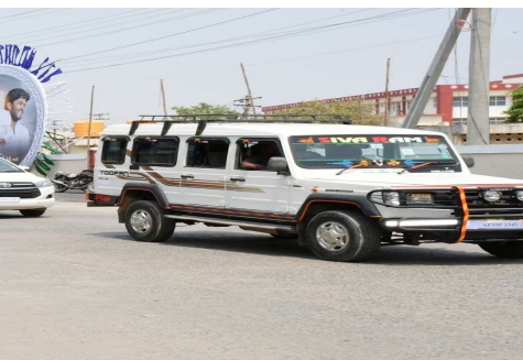
నుండి సభా వేదిక వద్ద వరకు కాన్వాయ్ ట్రైల్ రన్ నిర్వహించి, అధికారులకు, సిబ్బందికి పలు సూచనలు తెలియ చేశారు.

గ్యాలరీలో ఇరువైపులా విధులు నిర్వహించే పోలీస్ అధికారులు, సిబ్బంది అప్రమత్తంగా వ్యవహరించాలన్నారు. బస్సులు , కార్లు , మొదలగు ఇతర వాహనాలు వారికి కేటాయించిన ప్రదేశాలలో పోలీస్ సిబ్బంది ఒక వరుస క్రమంలో వాహనాలను పార్కింగ్ చేయించాలన్నారు. బందోబస్టు విధులు నిర్వహించే అధికారులు, సిబ్బంది అందరూ బాధ్యతాయుతంగా విధులు నిర్వహించాలని, ఎక్కడ అవాంఛనీయ ఘటనలు చోటుచేసుకోకుండా సిబ్బంది అందరూ తమకు కేటాయించిన పాంపుట్ల వద్ద అప్రమత్తంగా మెలగాలని సూచించారు. ఎవరైనా తమ విధులలో అలసత్వం వహిస్తే చర్యలు తప్పని హెచ్చరించారు. అనంతరం హెలిప్యాడ్