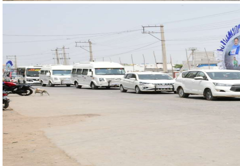
ఉన్నారు. వీరు కాకుండా ఏ.ఆర్ ఫోర్స్ , స్పెషల్ ఫోర్స్ బీటీ డీమ్ మొదలగునవి ఉన్నారు. హెలిప్యాడ్, సభా వేదిక ప్రాంతం,

గ్యాలరీలో ఇరువైపులా విధులు నిర్వహించే పోలీస్ అధికారులు, సిబ్బంది అప్రమత్తంగా వ్యవహరించాలన్నారు. బస్సులు , కార్లు , మొదలగు ఇతర వాహనాలు వారికి కేటాయించిన ప్రదేశాలలో పోలీస్ సిబ్బంది ఒక వరుస క్రమంలో వాహనాలను పార్కింగ్ చేయించాలన్నారు. బందోబస్టు విధులు నిర్వహించే అధికారులు, సిబ్బంది అందరూ బాధ్యతాయుతంగా విధులు నిర్వహించాలని, ఎక్కడ అవాంఛనీయ ఘటనలు చోటుచేసుకోకుండా సిబ్బంది అందరూ తమకు కేటాయించిన పాంపుట్ల వద్ద అప్రమత్తంగా మెలగాలని సూచించారు. ఎవరైనా తమ విధులలో అలసత్వం వహిస్తే చర్యలు తప్పని హెచ్చరించారు. అనంతరం హెలిప్యాడ్