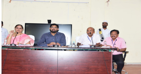
పరీక్షలను 17న ఉదయం 10:00 గంటల నుంచి మధ్యాహ్నం 12:00 గంటల వరకు మరియు మధ్యాహ్నం 02:00 గంటల నుంచి 04:00 వరకు పరీక్షలు రెండు సెషన్ లలో నిర్వహిస్తున్నట్లు తెలిపారు. గ్రూప్ - 1 పరీక్షల కోసం జిల్లాలో 7 వెన్యూ కేంద్రాలను ఏర్పాటు చేయడం జరిగిందని, పరీక్షలకు 3,675 మంది అభ్యర్థులు హాజరుకానున్నారు. పరీక్షల కోసం 7 మంది లైజన్ ఆఫీసర్ల (సీనియర్) జిల్లా స్థాయి అధికారులును నియమించడం జరిగిందని, 7 మంది చీఫ్ సూపరింటెండెంట్

- పరీక్షల కోసం అన్ని ఏర్పాట్లను పకడ్బందీగా చేపట్టాలి - హాజరుకానున్న 3,675 మంది అభ్యర్థులు - జాయింట్ కలెక్టర్ టి.రాహుల్ కుమార్ రెడ్డి