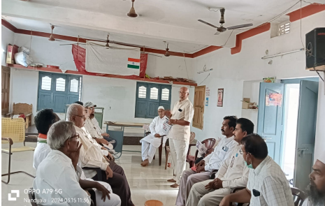
జరిగాయి. దానితో వెనక్కి తగ్గింది మళ్లీ ఇప్పుడు ఎలక్షన్స్ వస్తున్నాయి. కాబట్టి దీన్ని అడ్డుపెట్టుకుని అధికార లబ్ధి పొందడం కోసం ఇప్పుడు బిజెపి పార్టీ సీపిఐను తెరపైకి తెచ్చింది, భారతదేశంలో ఉండే లౌకికవాదులందరూ దీన్ని వ్యతిరేకించాలని వారు అన్నారు. వామపక్ష రాజకీయ పార్టీలతో అలాగే కాంగ్రెస్, ఆమ్ ఆద్మీ, ప్రజా సంఘాలతో సీపిఐకు వ్యతిరేకంగా మన నంద్యాలలో సెమినార్ జరుగుతుందని, ఈ యొక్క సెమినారుకు సిపిఐను వ్యతిరేకించే వాళ్ళందరూ హాజరయ్య