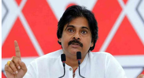
భారీ ఎత్తున మారక ద్రవ్యాల దిగుమతి చేసుకోవడం వెనుక

ఆంధ్ర ప్రదేశ్/అమరావతి మార్చి 22: : ఆంధ్రప్రదేశ్ రాష్ట్రాన్ని వైసీపీ ప్రభుత్వం మారక ద్రవ్యాలకు చిరునామాగా మార్చేసిందని జనసేన అధ్యక్షుడు పవన్ కల్యాణ్ ఆరోపించారు. నిన్న విశాఖ పోర్టులో 25 వేల కిలోల డ్రగ్స్ పట్టుబడడం ఆందోళనకరమని పేర్కొన్నారు. ఆంధ్రప్రదేశ్ రాష్ట్రానికి రాజధాని లేకుండా చేసిన వైసీపీ ప్రభుత్వం చివరకు మారక ద్రవ్యాలకు అడ్డాగా మార్చేసిందని దుయ్యబట్టారు. దేశంలో ఏకద్రవ్య గంజాయి పట్టుబట్టడం మూలాలు ఏపీలోనే ఉండడం సిగ్గు చేటని అన్నారు. ఈ అప్రదిష్టను మోస్తున్న తరుణంలో విశాఖ పోర్టులో 25వేల కిలోల డ్రగ్స్ దొరకడం మరింత ఆందోళన కలిగించే విషయమని తెలిపారు.