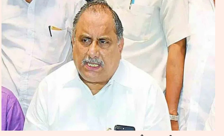
ఆంధ్ర ప్రగతి/అమరావతి మార్చి 24: ఏపీ కాపునేత ముద్రగడ పద్మనాభం సంచలన వ్యాఖ్యలు చేశారు. సినిమా వాళ్లు రాజకీయాల్లో పనికిరారని వర్తకంగా విరచించి, పవన్ కల్యాణ్ ఉద్దేశించి అన్నారు. ఆదివారం ఆయన మీడియాతో మాట్లాడారు. ప్రజారాజ్యం పార్టీ స్థాపించిన చిరంజీవి అనతికాలంలోనే పార్టీ జెండాను ఎత్తివేశారని, పవన్ కల్యాణ్ కూడా అదే దారిలో పయనిస్తాడని అన్నారు. ఏపీలో 175 అసెంబ్లీ, 25 ఎంపీ సీట్లు ఉండగా కేవలం 20 సీట్లకు మాత్రమే జనసేన అధినేత పరిమితపడడం శోచనీయమని అన్నారు. 20 సీట్ల కోసం పవన్ కు నేను ఎందుకు సపోర్ట్ చేయాలని, ఒక ఎంపీ, ఎమ్మెల్యే లేకుండా పార్టీ పెడితే నేను వెళ్తా అంటూ ప్రశ్నించారు. రాబోయే ఎన్నికల్లో పిఠాపురం నుంచి ఎమ్మెల్యేగా పోటీ చేస్తున్న పవన్ కల్యాణ్ ఓడిపోవడం ఖాయమని పేర్కొన్నారు. చంద్రబాబు తనను అనేక ఇబ్బందులకు గురిచేశాడని, చంద్రబాబు, పవన్ కల్యాణ్ ఓటమి కోసం పనిచేస్తానని వెల్లడించారు. ఏపీలో మరో 30 ఏళ్ల పాటు జగన్ సీఎంగా ఉంటారని జోస్యం చెప్పారు.