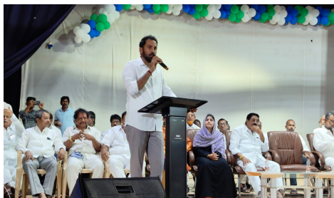
నాయకులు ప్రజల ప్రాణాలకు కాపాడటానికి శ్రమించారని తెలిపారు. గ్రామాలను, పట్టణాలలో గ్రామ సచివాలయాలు, వార్డు సచివాలయాలు, ఆర్టీసీ సెంటర్లు, హెల్త్ సెంటర్లు, అమృత్ నీటి పథకం, సీసీ రోడ్లు, సీసీ డ్రైన్లు, మౌలిక సదుపాయాలను కల్పించడం జరిగిందన్నారు. రానున్న ఎన్నికల్లో వైఎస్సార్ పీఠికి మరో అవకాశం కల్పించాలని అభిప్రాయం వ్యక్తం చేస్తూ ముఖ్యమంత్రి నంద్యాలలో అభివృద్ధి చేపట్టిన ఏకైక నాయకుడు జగన్ మోహన్ రెడ్డి అన్నారు. 2 సంవత్సరాల కాలంలో