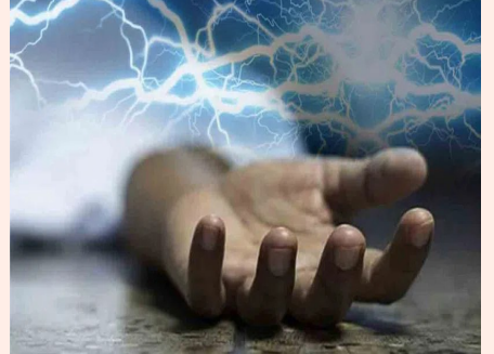
ఆంధ్ర ప్రగతి/అమరావతి మార్చి 24: నెల్లూరు జిల్లాలో విషాదం చోటు చేసుకుంది. అప్పటి వరకు మేకతాళాలు, బంధువుల సందడితో కళకళలాడిన ఇంట్లో తీవ్ర విషాదం నెలకొంది. పెజైన 11 రోజులకే విద్యుదాఘాతంతో మృత్యువాతపడడం రెండు కుటుంబాల్లో విషాదఛాయలు అలముకున్నాయి. అమరావతి : నెల్లూరు జిల్లాలో విషాదం చోటు చేసుకుంది. అప్పటి వరకు మేకతాళాలు, బంధువుల సందడితో కళకళలాడిన ఇంట్లో తీవ్ర విషాదం నెలకొంది. పెజైన 11 రోజులకే విద్యుదాఘాతంతో మృత్యువాతపడడం రెండు కుటుంబాల్లో విషాదఛాయలు అలముకున్నాయి.