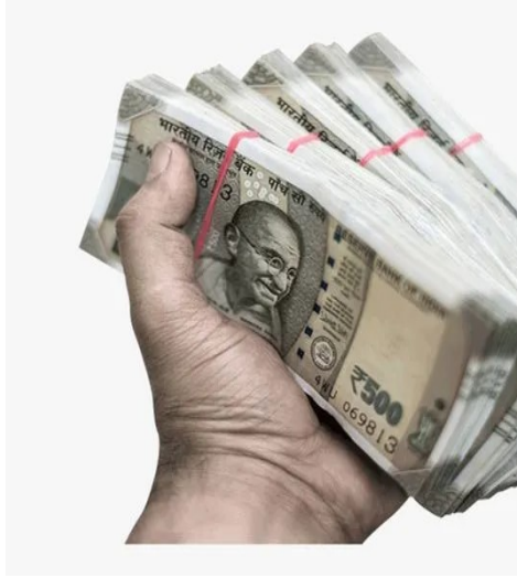
భవనాలకు సొమ్ములు తీసుకుంటారా ?

తాడేపల్లిగూడెంలో భవనాలు నిర్మిస్తే అధికార పార్టీ నేత సొమ్ములు తీసుకుంటారట కదా అంటూ ఓ మహిళ వ్యాఖ్యానించింది. ఇప్పుడిదే పట్టణంలో గొడవగా ఉండటా చెప్పుకొచ్చింది. అంటే తాడేపల్లిగూడెంలో అధికార పార్టీ అవినీతి దండా ఏ స్థాయిలో ఉందో అర్థమవుతోంది. భవన నిర్మాణాలు చేపట్టిన ప్రతి యజమాని నుంచి సొమ్ములు వసూలు చేశారు. టీడీఆర్ బాండ్ల జారీలోనూ పెద్ద మొత్తంలో అవినీతి జరిగింది. పట్టణంలో అభివృద్ధి కార్యక్రమాలలోనూ అక్రమార్గం చేశారు. ఇప్పుడదే అధికార పార్టీకి నీడలా వెంటాడుతోంది. కేవలం డబ్బు అధికంగా ఇచ్చి నెట్టుకు రావాలన్న తలంపుతో పార్టీ ఉంది. ఇప్పటికే వైఎస్ఆర్ కాంగ్రెస్ పార్టీలో ఉన్న నేతలంతా దూరమయ్యారు. చివర దశలో అధికార పార్టీ చేసిన ప్రయత్నాలు ఫలించలేదు.