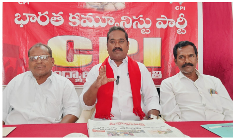
ఎద్దడి ఏర్పడిందని స్వయంగా జిల్లా కలెక్టర్ 18 మండలాల్లో నీటి ఎద్దడి తీవ్రంగా ఉందని ప్రకటించారని జిల్లాలోని అనేక