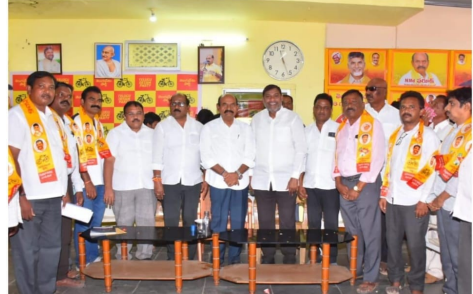
వారికి దేశభక్తి, నీతివంతమైన పాలన నిజాయితీ గల నాయకులు అంటే వారికి చాలా ఇష్టం వారు జీవితంలో చాలా క్రమశిక్షణతో జీవించినట్లుంటే వ్యక్తులు కాబట్టి వారి సేవలు తెలుగుదేశం పార్టీకి చాలా అవసరం వారందరూ కూడా తెలుగుదేశం పార్టీ గెలుపుకోసం అహర్నిశలు కృషిచేసి నంద్యాల ఎమ్మెల్యే సీట్ ను ఛార్జీ మెజారిటీతో గెలిపించుకొని చంద్రబాబు నాయుడు కి బహుమతిగా ఇవ్వాలన్నారు. ఇక 45 రోజుల్లో ఈ వైఎస్ఆర్ పి ప్రభుత్వానికి చరమగీతం పాడుతామన్నారు అందరూ కలిసి కట్టుగా కృషి చేయాలన్నారు అదేవిధంగా తెలుగుదేశం పార్టీ జెండాను రేపరేపలాదిస్తూ విజయదండం మోగించాలని పిలుపునిచ్చారు.