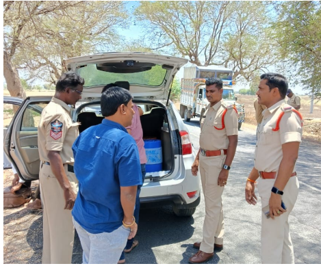
ఎన్నికల నియమ నిబంధనలకు లోబడి నగదును, బంగారం వెండి, ప్రోత్సాహక బహుమతులు మొదలగు వాటిని సీజ్ చేసి శ్రీ మ్యాన్ కమిటీకి అప్పగించడం జరుగుతుంది. 16-03-2024 నుండి ఇప్పటి వరకు సీజ్ చేసిన నగదు, బంగారం, వెండి