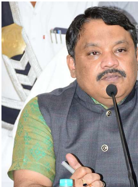
రిజిస్ట్రేషన్ తీసుకోవాలన్నారు. అలాగే 40 లక్షల వార్షిక టర్నోవర్ కలిగిన వ్యాపారస్తులు (గూడ్స్ పై) తప్పనిసరిగా జిఎస్టీ రిజిస్ట్రేషన్