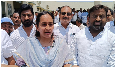
నంద్యాల జిల్లా కలెక్టరేట్ సమీపంలో విలేజ్ కలెక్టరు సమావేశంలో వారు మాట్లాడుతూ.. నంద్యాల అనేది వ్యాపారానికి ప్రసిద్ధి అని