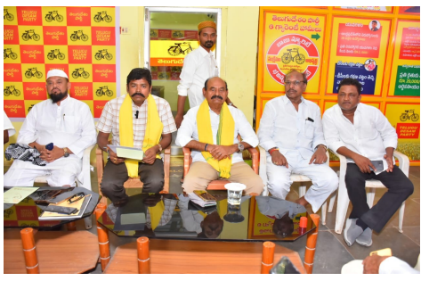
పింఛన్లు ఇంటి వద్ద పంపిణీ చేయడం సాధ్యం. కానీ జగన్ రెడ్డి