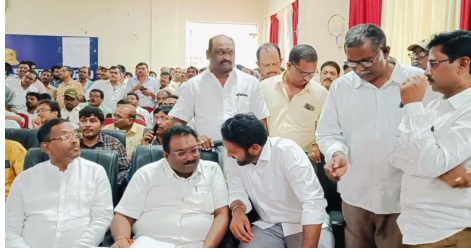
పట్టణంలో వ్యాపారస్తులు ధర్మాకు దిగారని, మోడల్ కోడ్ ఆఫ్ కాండక్ట్ పై అవగాహన లేకపోవడంతో ఇబ్బందులు వద్ద విషయాలను తన దృష్టికి తీసుకో రావడం జరిగిందని తెలిపారు. వీరందరి పక్షాన నేడు జిల్లా కలెక్టర్, ఎస్సీ, ఇతర అధికారులను కలిసి వివరించడం జరిగిందన్నారు. 95శాతం పైగా వ్యాపారస్తులు రాజకీయాలకు సంబంధం లేకుండా వ్యాపారం చేసుకునే వారని, మోడల్ కోడ్ ఆఫ్ కాండక్ట్ ఎలా పాటించాలో వారికి అవగాహన