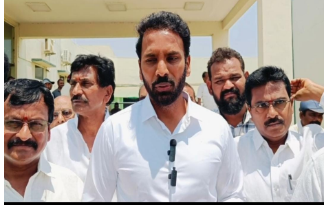
లేదని, నిబంధనల ప్రకారం వ్యాపారం ఎలా చేసుకోవాలో ఎటువంటి పత్రాలు వారి వద్ద ఉండాలో, నగదు, పన్నులను తీసుకువెళ్లాలంటే ఎటువంటి పత్రాలు వారి వద్ద ఉండాలో అనేక మైన సందేహాలను కలిగి ఉన్నారని, కాబట్టి అధికారులు వారికి అవగాహన కల్పించి, సందేహాలను నివృత్తి చేయాలని కోరారు.