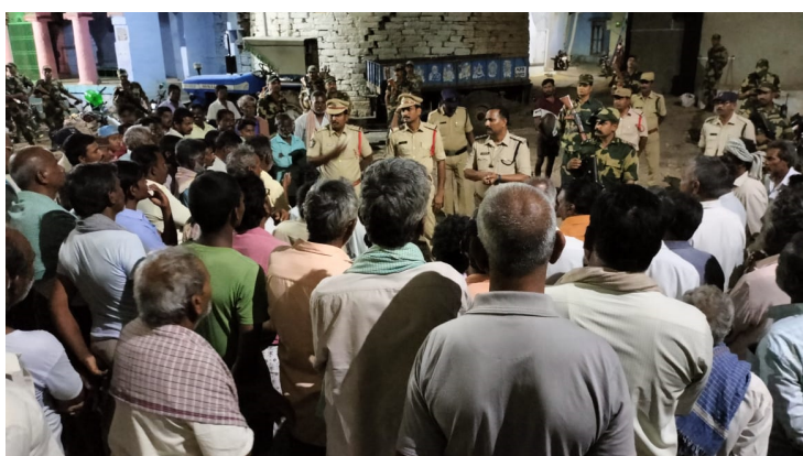
జరిగే విధంగా పోలీసు వారికి ప్రజలకు భరోసా కల్పించేందుకు , సహకరించాలని మరియు రాజ్యాంగం ద్వారా సంక్రమించిన ఓటు శాంతిభద్రతలను కాపాడడానికి, హక్కును స్వేచ్ఛగా వినియోగించుకునేలా