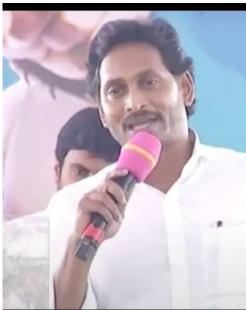
చేస్తున్న విషయం తెలిసిందే. ఈ యాత్రలో సీఎం జగన్ ఎక్కడికి వెళ్లినా జనం నీరాజనాలు

ఏపీలో ఎన్నికలు సమీపిస్తున్నా కొద్ది రోజులు వాడీ వేడిగా తయారవుతున్నాయి. ఎవరి గెలుపు ధీమా వారు వ్యక్తం చేస్తున్నారు. అధికార పార్టీని ఎలాగైనా ఓడించాలని ప్రతి పక్షాలు టీడీపీ, జనసేన, బీజేపీ కూటమిగా ఏర్పడ్డ విషయం తెలిసిందే. ఈ కూటమి రాష్ట్ర వ్యాప్తంగా ముమ్మర ప్రచారం చేపట్టింది. ఇక తాము చేసిన అభివృద్ధి ప్రజలు గమనిస్తున్నారని.. ఈ ఏన్నికల్లో ఓటం గానే పోరాడుతామని అధికార పార్టీ ముందుకు సాగుతుంది. అధికారంలోకి వచ్చిన తాము చేసిన అభివృద్ధి సంక్షేమ పథకాలు ప్రజల్లో తీసుకువెళ్తుంది వైసీపీ. ప్రస్తుతం సీఎం జగన్ మేమంతా సిద్ధం బన్ను యాత్ర కొనసాగుతుంది. ఈ సందర్భంగా కీలక వ్యాఖ్యలు చేశారు సీఎం జగన్. వివరాలికి వెళ్లితే.. ఆంధ్రప్రదేశ్ లో మరో ఐదు వారాలలో ఎన్నికలు జరగబోతున్నాయి. అధికారం కోసం జగన్ ని ఎలాగైనా ఓడించాలని కూటమి.. పేదల ప్రజల అభ్యున్నతికి పట్టం కట్టాలంటే మరోసారి ఛాన్స్ ఇవ్వమని అధికార పార్టీ ప్రజల్లోకి వెళ్తున్నారు. ఈ క్రమంలోనే సీఎం జగన్ 'మేమంతా సిద్ధం బన్ను'