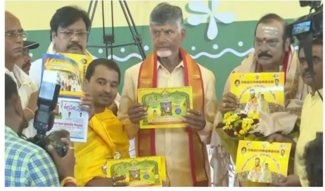
ఆయన మాట్లాడుతూ..చంద్రబాబుకు ఈ ఏడాది కలిసి వస్తుంది న్నారు. చంద్రబాబుకు అధికార యోగం ఉందని తెలిపారు.