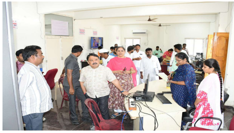
2,186 గ్రాముల మాదకద్రవ్యాలు, రూ.38,45,960/- విలువైన 3,027 గ్రాముల ఆభరణాలు, రూ.8,51,406/-ల విలువైన ఇతర వస్తువులను వెరన్ మొత్తం రూ. 4,19,19,813/- లను