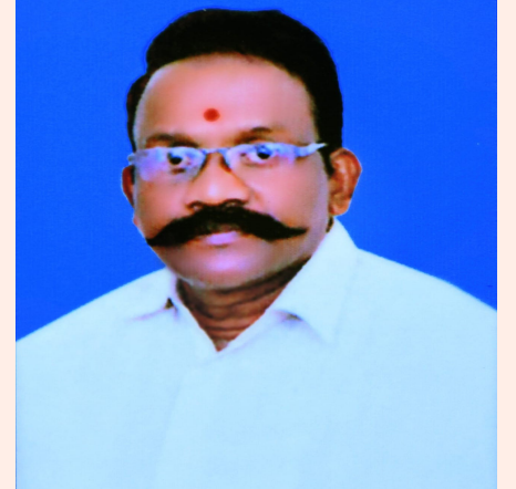
జనసేనకు రాజీనామా చేశారు.